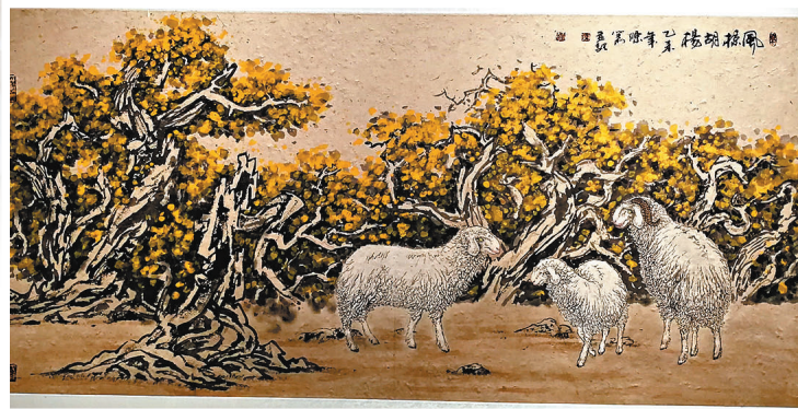
◆桑皮紙繪畫《風掠胡楊》