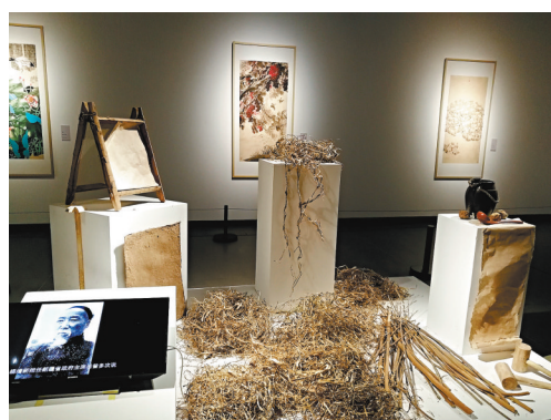
◆展覽展出的有關桑皮紙的視頻影像、材料實物等。

經過十多年的傳承發展，如今的新疆桑皮紙與美術創作、文化旅遊、鄉村振興深度融合，發揮了非遺的賦能作用，實現了非遺文化的公益性和市場性價值。在和田地區墨玉縣、吐魯番市，製作和銷售桑皮紙已經是當地農民居家就業、增收致富的好途徑。而觀賞和體驗桑皮紙造紙技藝，也日益成為國內外遊客新疆之行的必選打卡項目。