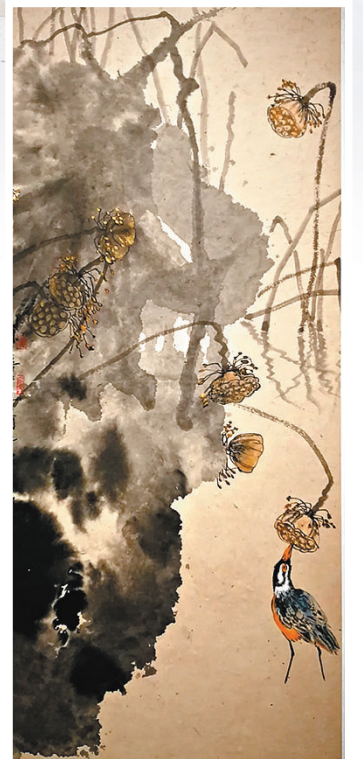
◆桑皮紙繪畫《荷塘留香》