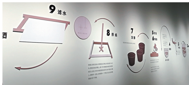
◆展覽展出桑皮紙製作工序。