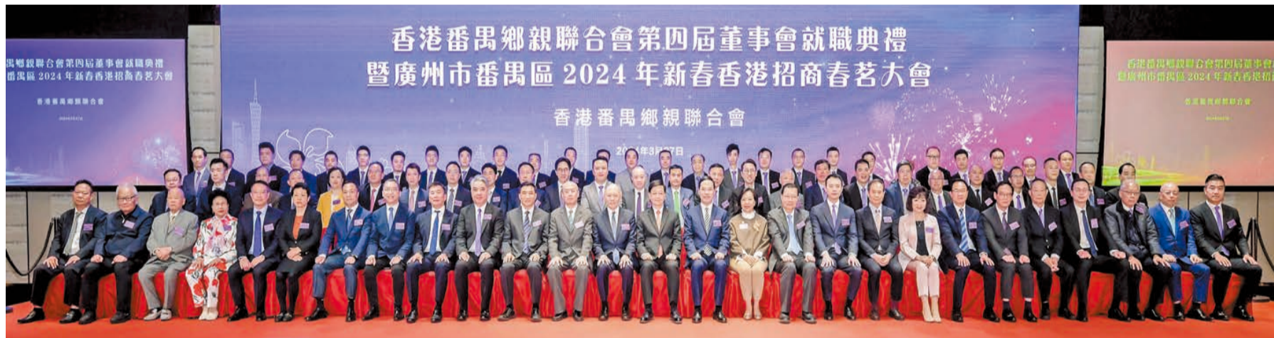
廣州市番禺區在香港舉辦香港番禺鄉親聯合會第四屆董事會就職典禮暨廣州市番禺區2024年新春香港招商春茗大會，賓主合照。

【香港商報訊】3月27日，廣州市番禺區在香港舉辦香港番禺鄉親聯合會第四屆董事會就職典禮暨廣州市番禺區2024年新春香港招商春茗大會，與香港政界、商界知名人士，番禺籍廣州市榮譽市民，旅港番禺鄉親共賀新春、共敘鄉情、共謀發展。香港特別行政區行政長官李家超，外交部駐港公署參贊、領事部主任魏文修，香港特區政府民政及青年事務局局長麥美娟，番禺區委書記黃彪，區委常委、統戰部部長、區政協黨組副書記鄧耀棋，區委常委、區委辦主任鄧展鵬，香港番禺鄉親聯合會會長霍啟文、主席李民強，以及區有關職能部門的領導出席大會。