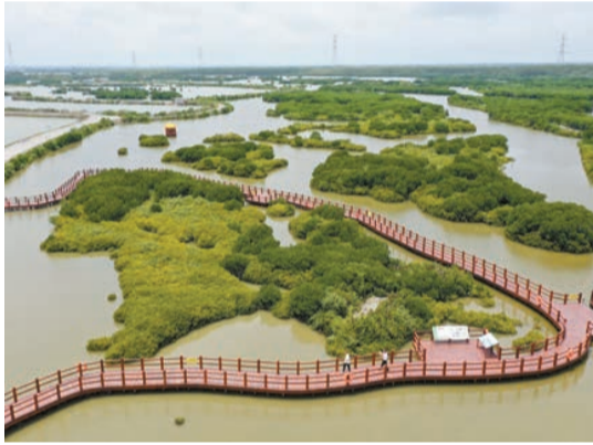
湛江金牛島紅樹林。資料圖片