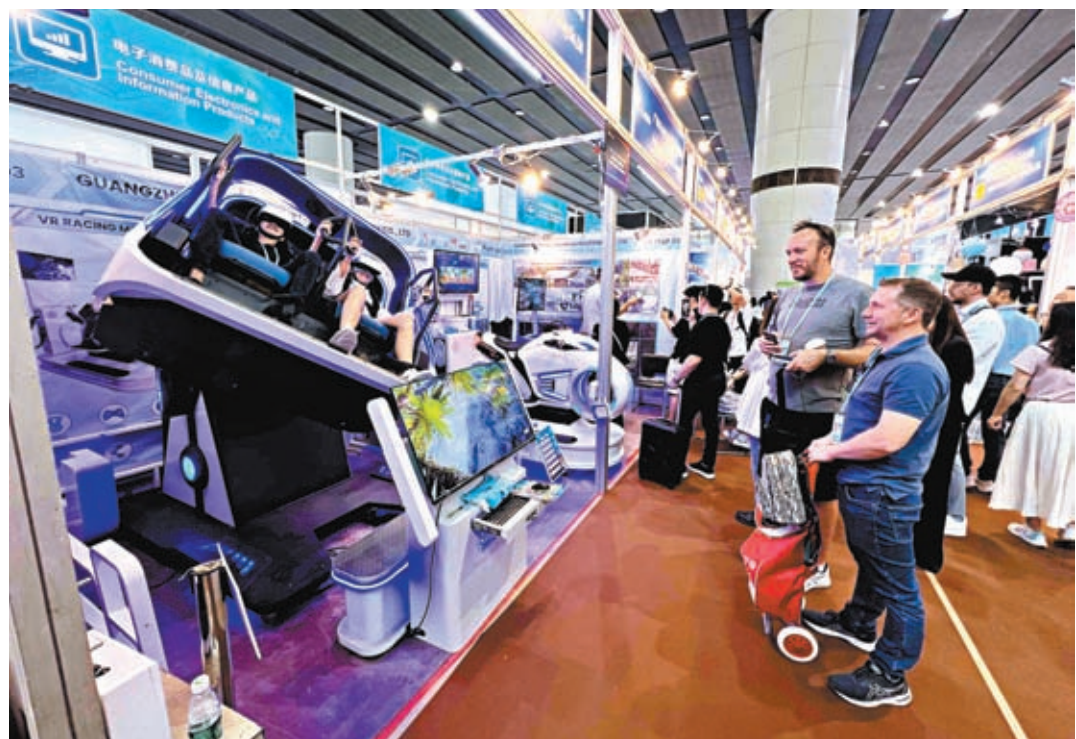
第135屆廣交會（春交會），將於4月15日至5月5日在廣州舉辦。美國沃爾瑪等129家頭部企業確認組團參會，較上屆同期增長87%。圖為第134屆廣交會上境外採購商在體驗360度翻轉虛擬過山車。資料圖片

此外，大商不斷增多。全球零售250強和各國各地區大商明顯增多，美國沃爾瑪、必樂透、亞馬遜、法國歐尚、家樂福、施耐德、英國特易購、森寶利、翠豐、德國麥德隆、TEDI、歷德、瑞典宜家、日本似鳥、大創、墨西哥科佩爾等129家頭部企業確認組團參會，較上屆同期增長87%。