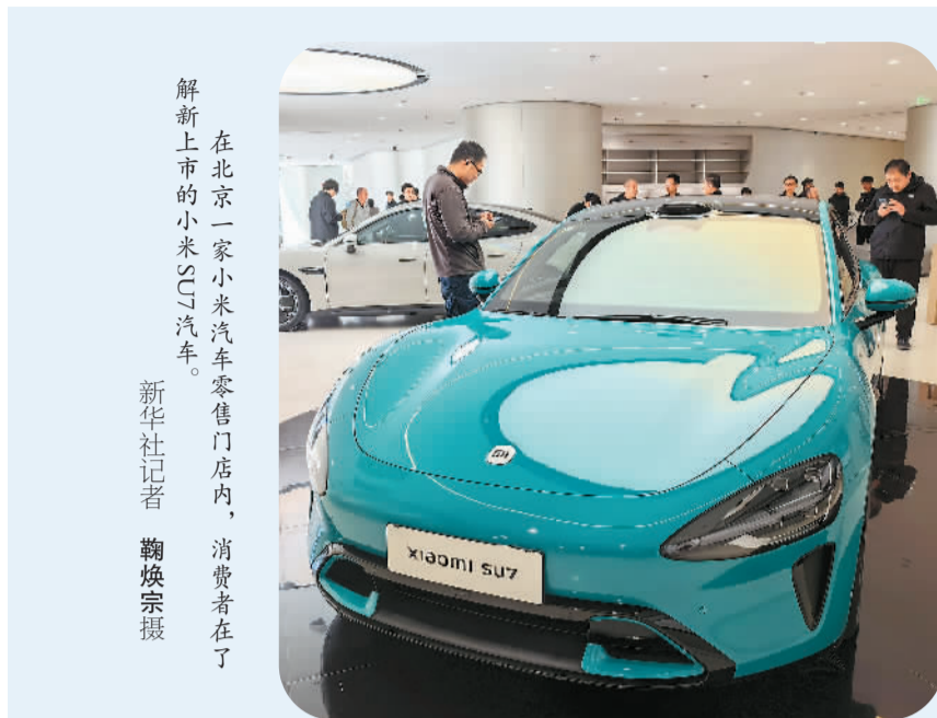
在北京一家小米汽车零售门店内，消费者在了解新上市的小米SU7汽车。