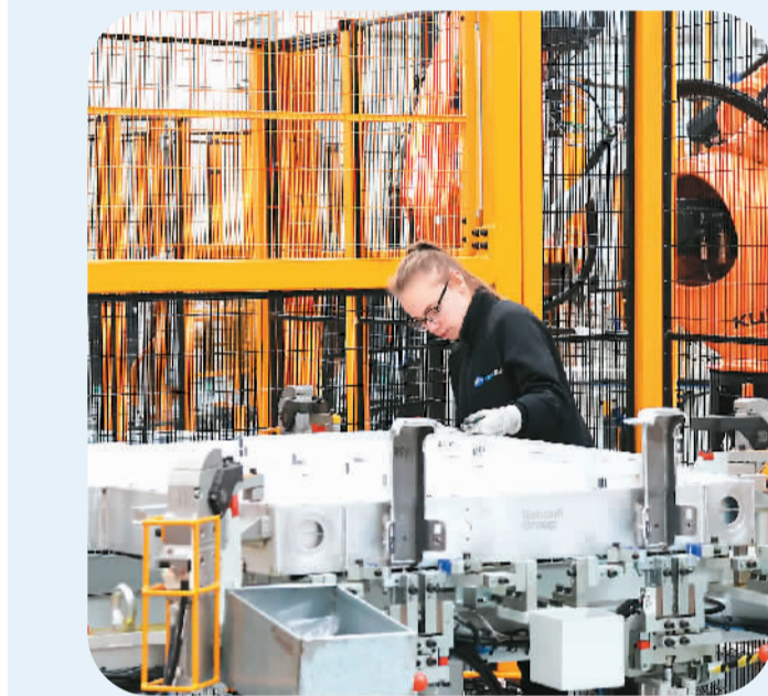
在法国吕茨，中国敏实集团与法国雷诺集团合资公司的员工在电池盒生产线上工作。