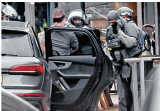
◆一名男子被特警部隊逮捕。

香港文匯報訊 荷蘭東部城鎮埃德市中心3月30日發生多名人質遭挾持事件，一名男子攜帶武器和爆炸物，在市中心一間酒吧挾持4人，並威脅引爆炸彈。挾持事件持續約數小時後結束，所有人質安全獲釋，疑犯被捕。當地警方稱，沒有跡象顯示事件出於恐怖主義動機。