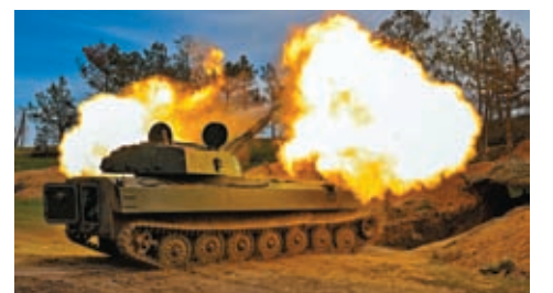
◆俄烏衝突持續，圖為烏軍向俄軍發炮。

澤連斯基接受《華盛頓郵報》訪問時則說，美國的援烏方案正因意見分歧而在國會受阻，若得不到美國承諾的軍事援助，烏軍將不得不「一步一步地」撤退。他說，「若沒有美國支持，就意味我們沒有空防、愛國者導彈、電子戰干擾器、155毫米口徑炮彈。這代表我們要走向頭路，一步一步地撤退。」