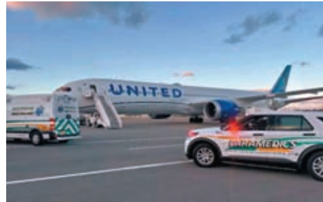
◆多名乘客因機身劇烈震盪而受傷，被送往附近醫院治療。

香港文匯報訊 據美國廣播公司（ABC）報道，美國聯合航空公司一架由以色列特拉維夫飛往新澤西州紐瓦克國際機場的航班，3月29日因降落時遇上「風切變」（wind shear），即風向突然出現變化，客機改飛往紐約斯圖爾特國際機場，最終安全降落，多名乘客因機身劇烈震盪而受傷，被送往附近醫院治療。