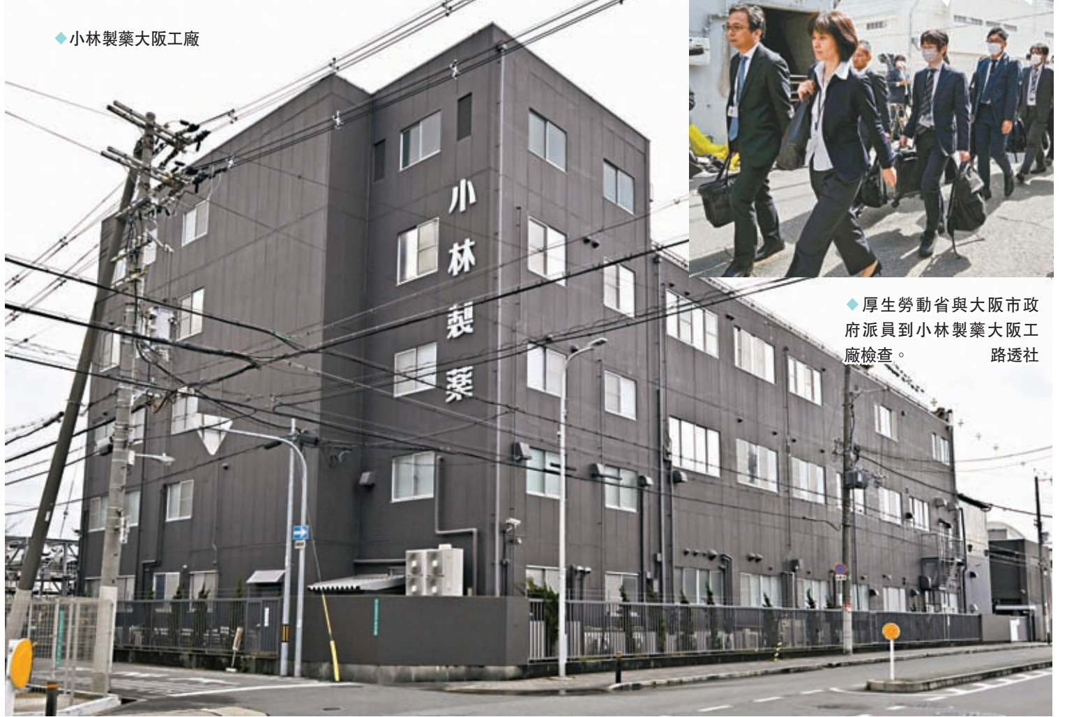
◆厚生勞動省與大阪市政府派員到小林製藥大阪工廠檢查。

香港文匯報訊 日本消費者服用小林製藥含紅麴保健食品後陸續罹患腎臟疾病，小林製藥不單在回收產品上拖延，連早於3月25日確認產品內摻雜含有毒性的「軟毛青黴酸」也未有公布，而是由厚生勞動省於3月29日公開，小林製藥再引來猛烈批評，該公司則辯稱是不想造成混亂。