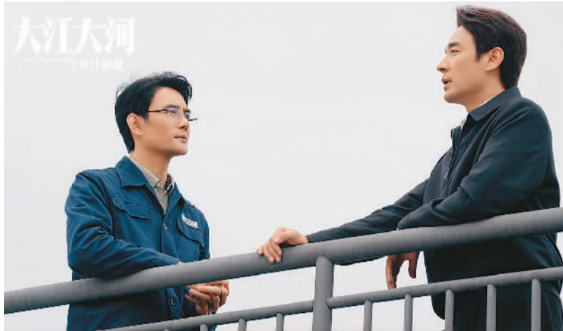
▲电视剧《大江大河之岁月如歌》海报。

今年以来，《繁花》《大江大河之岁月如歌》等多部由文学作品改编的影视剧成绩亮眼。比如由王家卫执导、改编自金宇澄同名茅盾文学奖作品的《繁花》，开播仅10分钟收视率就突破2%，截至目前有超过44万名观众在豆瓣平台打出8.7的高分。