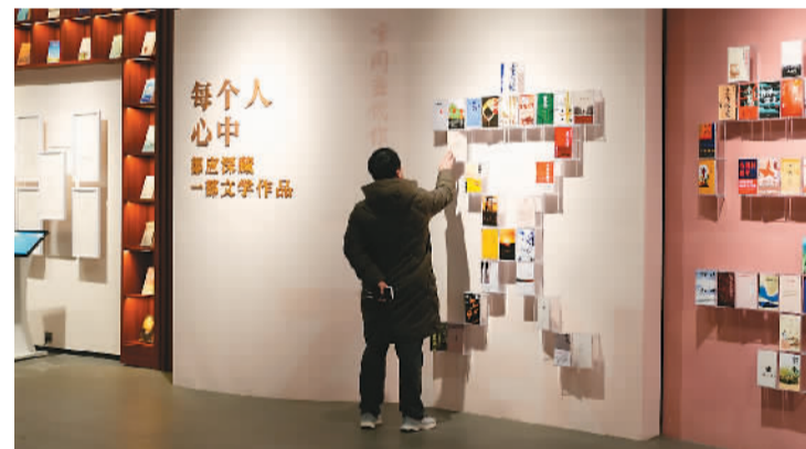
游客在清溪村参观“为时代和人民放歌——中国当代作家文学成就展”。

专家们围绕会议主题进行了交流。中国作协副主席陈彦谈到，多角度、全方位记录这个时代的“创业史”与“山乡巨变”，抵达“乡土”上那些情感的最深处，是作家们不可缺位的工作。北京作协副主席乔叶表示，乡村、农村、村庄、时代，这些词语都蕴藏着文学的富矿，其中最具有核心价值的矿脉永远是人。