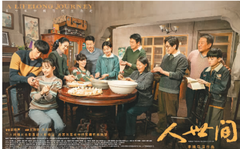
▲电视剧《人世间》海报。