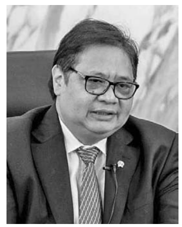
经济事务统筹部长艾朗卡

【本报讯】管理英雄商场、宜家、Guardian网络的英雄商场上市公司对政府将增值税提高至12%的决定作出反应。