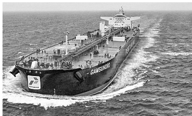
北塔米纳国际航运公司的油轮

【本报讯】北塔米纳国际航运(PIS)已准备好在圣斋月期间维护燃料油和液化石油气的稳定分销,直至伊历1445年开斋节之后。PIS甚至成立了一个特别工作组,并准备了多达326艘船只,以确保在这个特殊时刻全国的能源得以顺利供应。