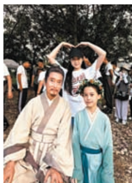
◆高雄與劇中演孫女(右一)的小演員合照留念。

他，觀眾也喜歡他，因為他唱得好，中英粵都唱，且記性好，一口氣可以唱十幾首，又會和觀眾互動，與真正的歌手沒有分別！更好的是沒有太多要求，好能夠和主辦單位配合。 這位大哥說今時今日，最重要身體健康才能享受人生，所以他可以享受拍戲、享受旅行、享受經常飛來飛去的生活！ 跟他提到近期金庸先生的紀念活動，原來他也演過不少金庸筆下的人物，他說《射鵰英雄傳》、《神鵰俠侶》都有客串，角色名已記不起，《笑傲江湖》中演掃地僧。