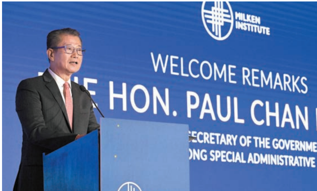
◆陳茂波致辭時表示，香港短期的政策目標是要提振信心。

米爾肯研究院過去一直以新加坡為基地，定期與東南亞金融界和投資界的領袖探討時下議題。今次是該智庫首次在香港舉行峰會，本屆峰會主題為「共同繁榮：銜接全球市場」。峰會26日吸引逾550位來自不同行業的高管參與，逾半人來自海外，他們深入探討世界變遷、科技進步以及資金流動帶來的挑戰和機會。陳茂波首先歡迎米爾肯研究院及與會嘉賓來到香港，認為香港是亞洲，甚至是全世界最好的「連結全球市場」的地方。