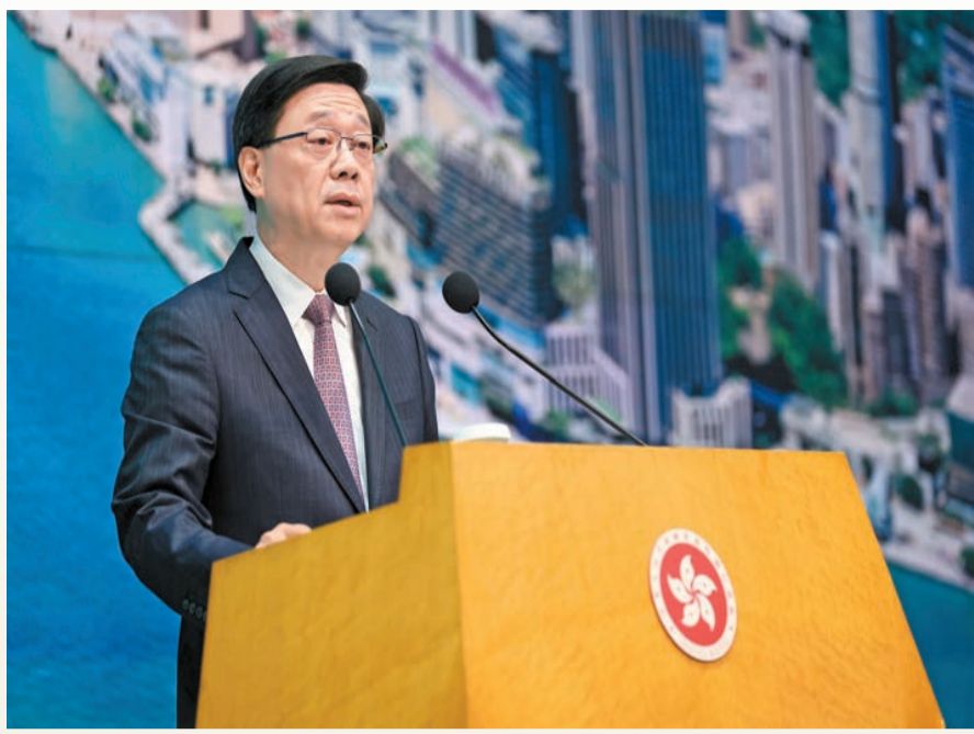
李家超指，政府會繼續大力吸引企業、資金、人才。

【香港商報訊】記者戴合聲報導：行政長官李家超昨日出席行政會議前會見媒體時表示，維護國家安全條例生效後，香港的安全得到保障，特區政府將從落實好施政報告和財政預算案提出的推動經濟發展措施、把握機遇、增強香港競爭力、發展內部經濟等四個方面的重點工作入手，帶領香港拼經濟、拼發展。李家超表示，首先要落實鞏固和發展「八大中心」在