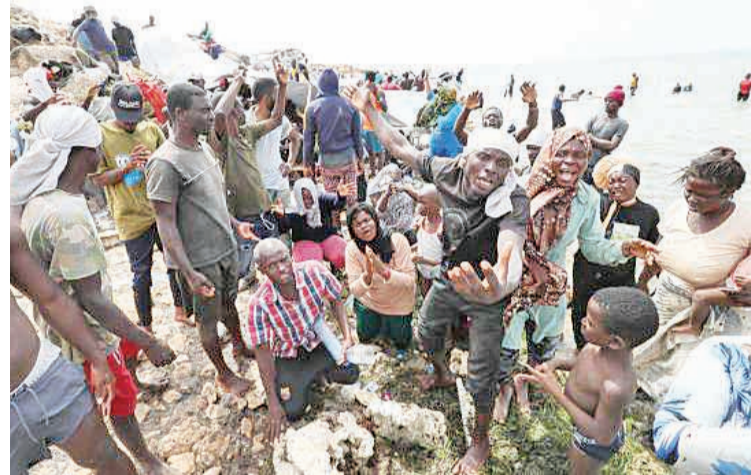
2023年7月26日，在突尼斯与利比亚边境的艾季迪尔角，众多移民滞留在地中海海岸边。

新华社北京3月27日电 国际移民组织26日发布报告，显示过去10年超过6万人在通过非正规渠道移民途中死亡或失踪，其中多数死于地中海等海域。这一数字可能只是冰山一角。根据报告，2014年至2023年，至少63285人在移民途中死亡或失踪后被推定死亡。其中近60%死者为溺水死亡；取道地中海前往欧洲而中途遇难的人数最多，超过2.8万；还有数以千计的人死于其他路线，例如在大西洋海域，在墨西哥与美国边境地区。过去10年中，经非正规渠道移民死亡者最多的年份是2023年，达8541