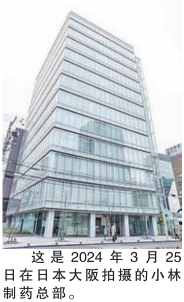
这是2024年3月25日在日本大阪拍摄的小林制药总部。

新华社东京3月27日电(记者钱铮)日本厚生劳动省26日发文给小林制药公司总部所在的大阪市健康局说，继小林制药当天公布一名服用该公司含红曲成分保健品的消费者因肾病死亡后，同一天又接到第二例消费者服用后死亡的报告。厚生劳动省要求大阪市健康局依法