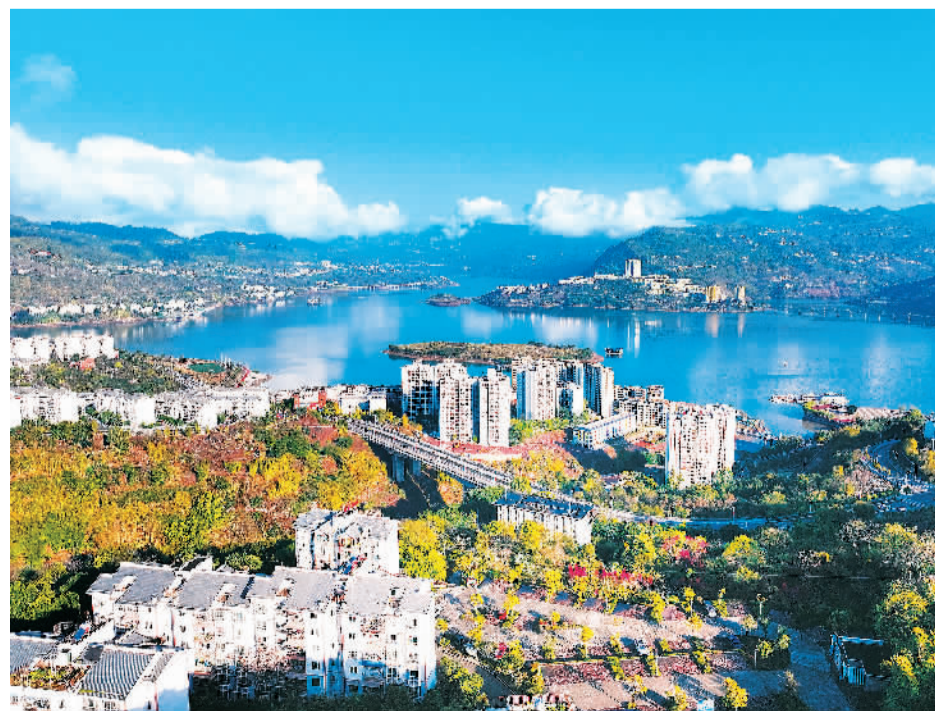
近年来，云南省昭通市持续加强河流湖泊流域综合整治，系统推进控源减排、生态修复等，有力推动经济社会发展绿色转型。图为3月25日，向家坝库区昭通市绥江县段周边景色。

伍德伦和苏博科高度评价中国经济社会发展取得的成就，看好中国超大规模市场机遇，对中国未来发展充满信心。两国企业均表示将坚持在华发展长期战略，继续加大在华投资力度，深化同中国在绿色低碳、医药健康等领域合作，推动美中、中英互利合作取得更多成果。