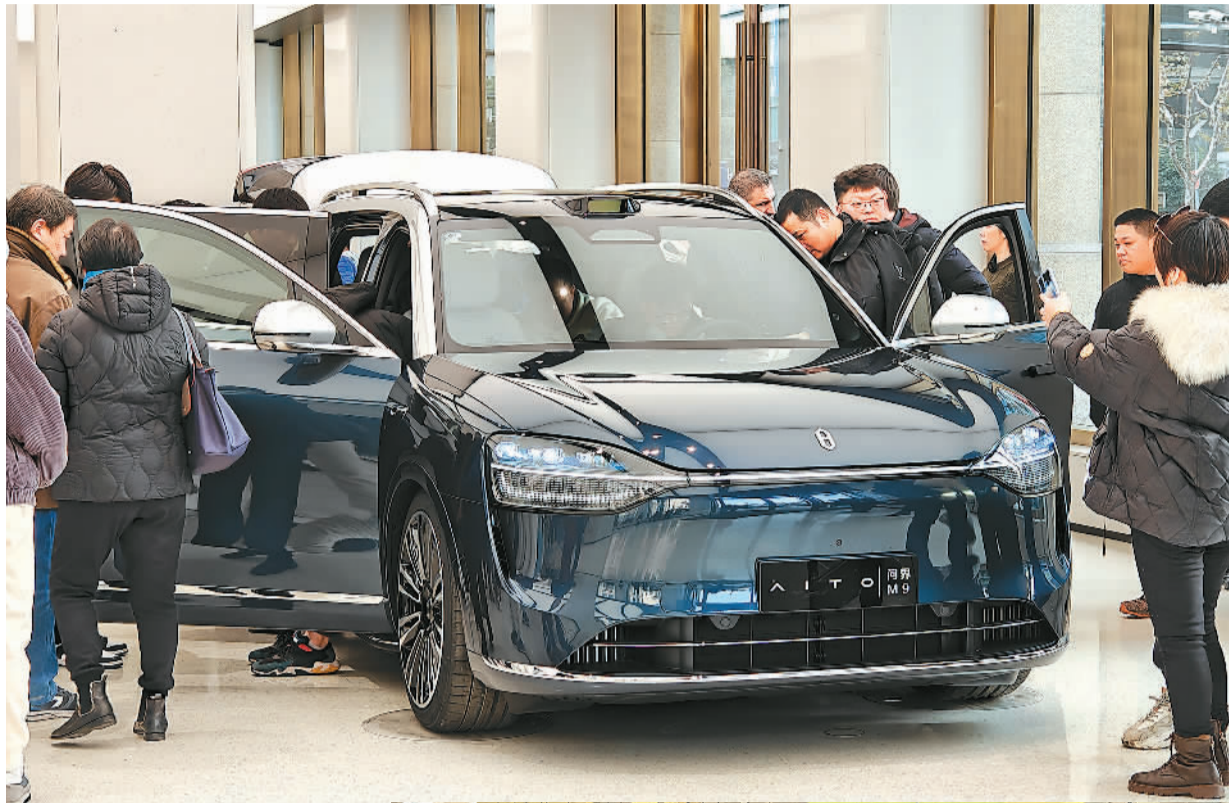
▲上海黄浦区华为专卖店，新发布的问界M9车型吸引大量顾客关注。

2023年，日系车在华零售约370万辆，同比下降9.9%，销量份额连续3年下滑，降至17%，处于低点。美系车的福特和通用销量同比有所下滑，法系车呈现收缩状态，德系车在华销量同比微增。