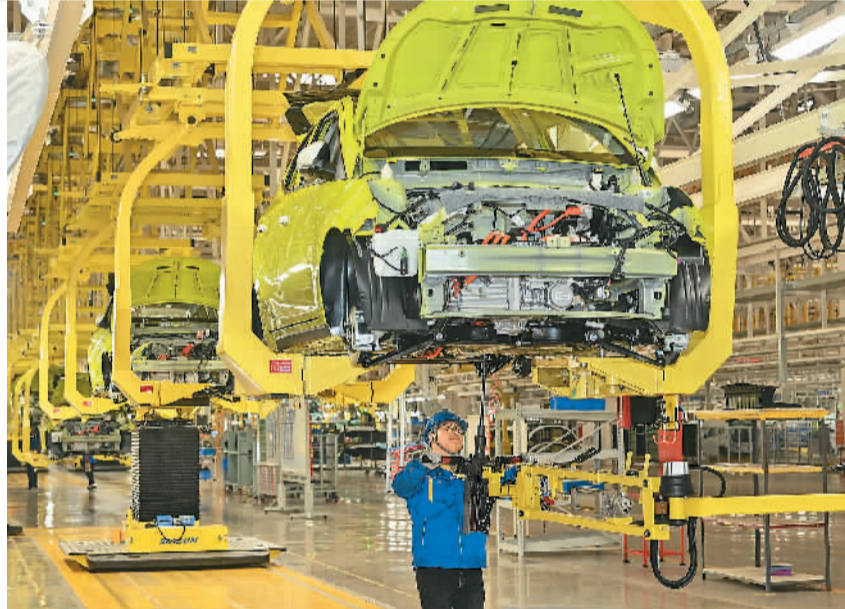
▶2月27日，在江西江铃集团新能源汽车有限公司总装车间生产线上，工人正加紧生产订单产品。