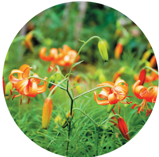
▲太空育种山丹丹新品种“延丹1号”。

据了解，新航天实验室是由国家监管部门批准的具有地面模拟航天诱变、太空诱变育种、航天农业、都市农业、乡村振兴、卫星互联、科普教育资质的太空农业实验室。