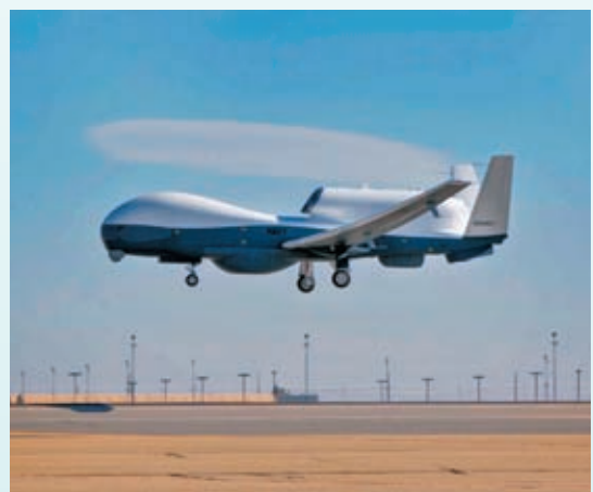
◆美海軍MQ-4C海神無人機

「美軍南海軍事活動正在給中美關係乃至地區帶來越來越大的風險。」報告稱，西太美軍越來越處於過度部署和過度疲勞的狀態，重大事故不斷，美軍的專業性下降不利於中美兩軍在南海的良性互動。報告警告，美軍在南海及其周邊針對中國越來越激進的軍事行動必然會招致解放軍的強力反制。