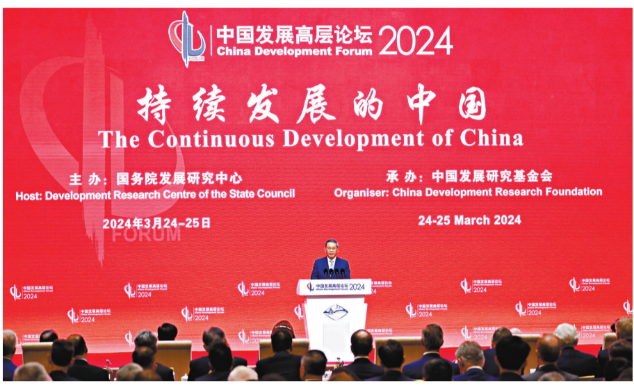
◆3月24日，中國國務院總理李強在北京出席中國發展高層論壇2024年年會開幕式，並發表主旨演講。 新華社

香港文匯報訊 據新華社報道，中國國務院總理李強3月24日在北京出席中國發展高層論壇2024年年會開幕式，並發表主旨演講。李強表示，本次年會以「持續發展的中國」為主題，既是對長期以來中國經濟發展狀況的客觀描述，也充分體現了各界對中國經濟行穩致遠、高質量發展的關注和期許。過去一年，在以習近平同志為核心的黨中央堅強領導下，我們頂住外部壓力、克服內部困難，圓滿完成了全年經濟社會發展主要目標任務。經濟回升向好的態勢持續鞏固增強，新產業、新模式、新動能加快成長壯大，中國經濟韌性強、潛力大、活力足，長期向好的基本沒變。