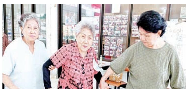
中间这位老奶奶已经99岁了，仍然积极参加乐龄俱乐部的活动