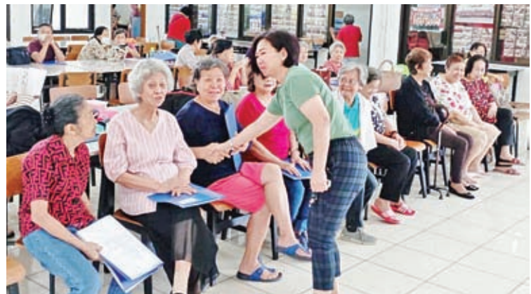
这位中年女士是乐龄俱乐部的志愿者