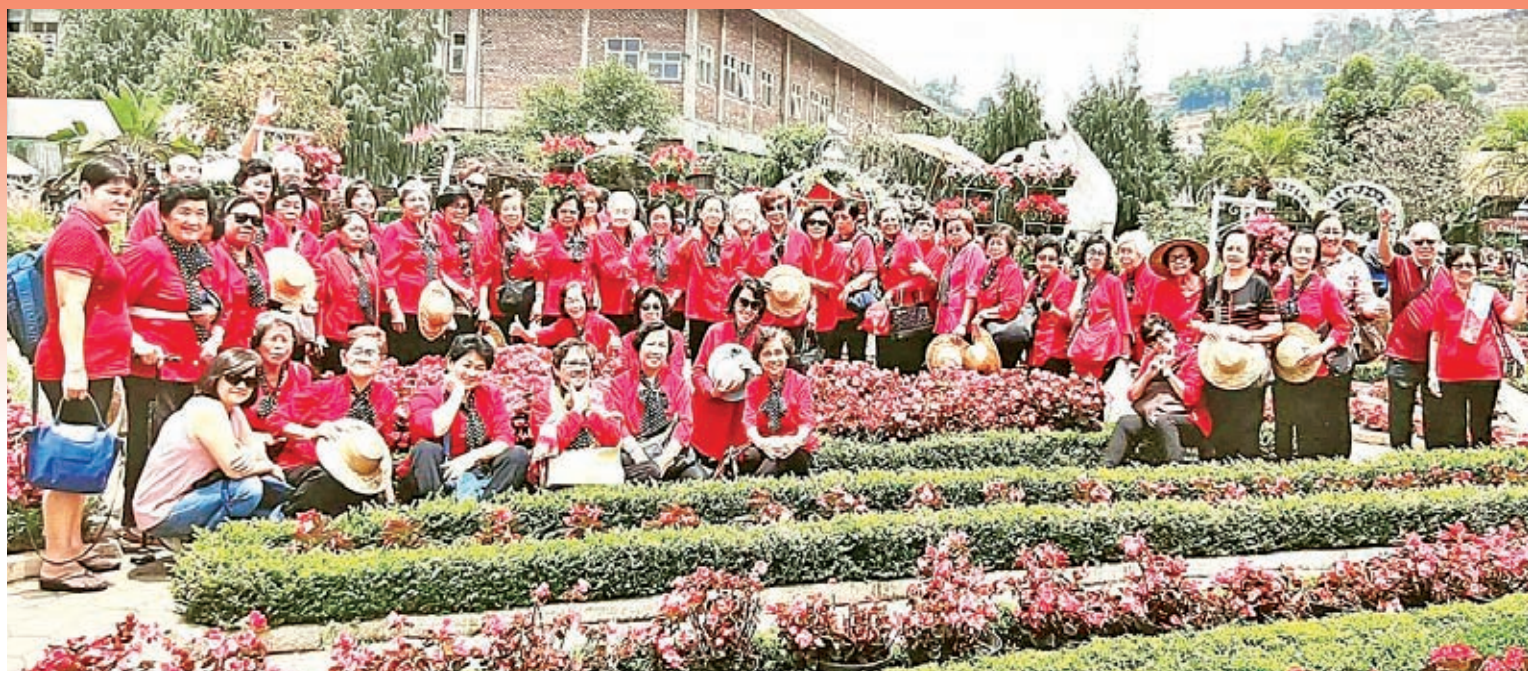
苏加巫眉爱心乐龄俱乐部成员户外旅行的合影