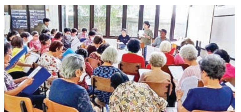
俱乐部的声乐课堂