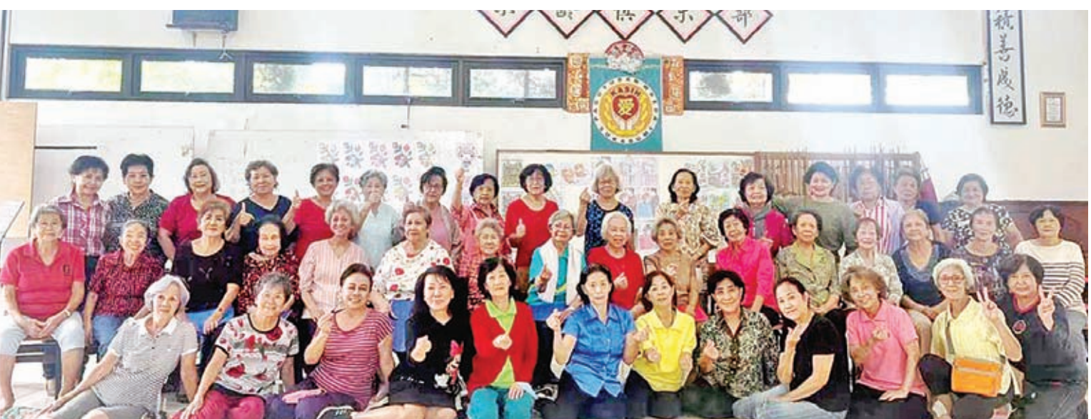
在爱心乐龄俱乐部的礼堂