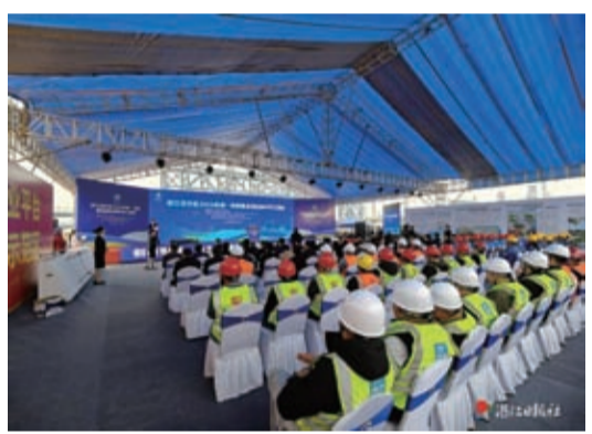
2月28日，湛江經開區2024年第一季度重點項目集中開工活動在東海島石化園區舉行。