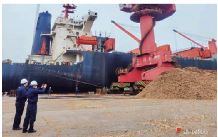
霞山海關關員現場監管進口木片卸貨。

近日，滿載着1.7萬噸闊葉木片的貨輪“青誠達99”輪順利停靠湛江港卸貨。湛江海關所屬霞山海關提前安排關員加班