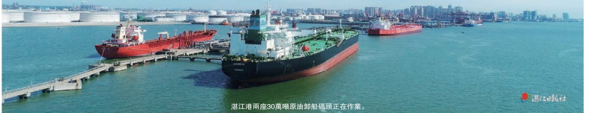
湛江港兩座30萬噸原油卸船碼頭正在作業。

進入2024年，湛江市推進西部陸海新通道建設繼續呈現穩步發展的態勢。近日，據陸海新通道運營湛江有限公司（下稱“湛江平臺公司”）統計的最新數據顯示，2024年1月，湛江平臺公司累計開行班列59列，完成集裝箱重箱量2927TEU，貨值約4.56億元。