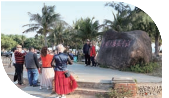
“中國大陸最南端”吸引眾多的游客前來游玩。

有的人一提到“鮮美”就祇想到湛江的海鮮，注意力都集中到品吃海鮮上，這其實是一種局限性思維。“鮮美湛江”可以細化為“三鮮三美”，即空