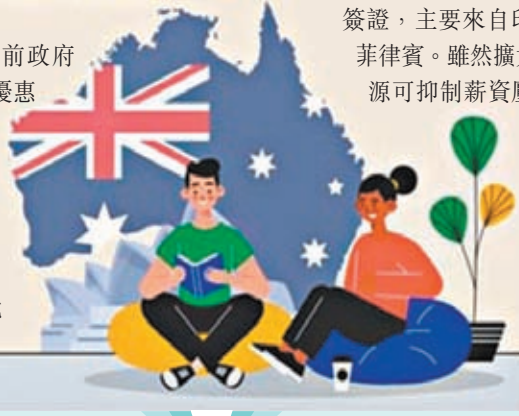
◆印度學生是留學澳洲主要群體之一。

新措施將有助於進一步壓低淨移民增長，並修正澳洲的移民體系。統計局最新公布的數據顯示，截至去年9月，澳洲人口增加近66萬人，增幅2.5%，是歷來最高；當中有54.8萬人都是海外移民，大部分是學生及臨時工作簽證，主要來自印度、中國和菲律賓。雖然擴大勞動人力資源可抑制薪資壓力，但卻加劇本就緊張的住房市場。