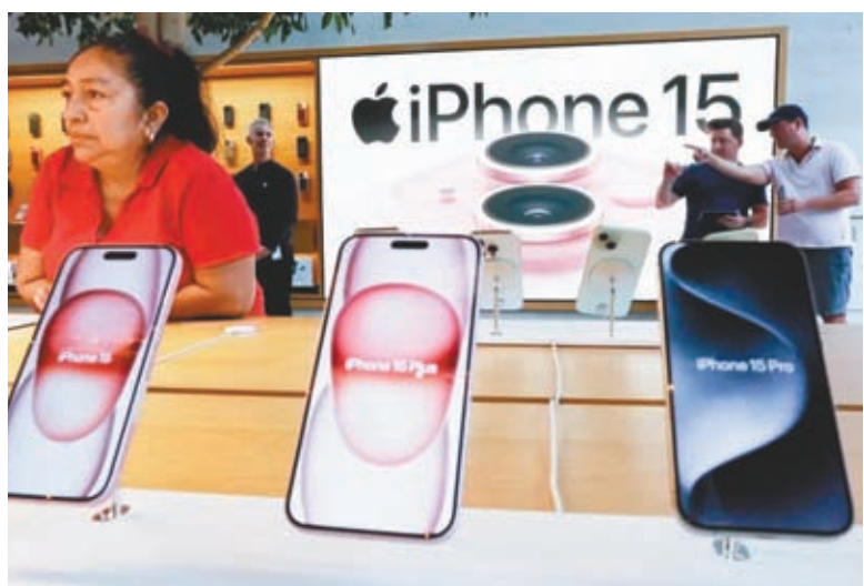
◆美國司法部指蘋果壟斷行為犧牲消費者、開發者和競爭對手手機製造商的利益。

依照歐盟針對科企巨擘的新法案《數碼市場法案》，蘋果在歐盟還可能面臨更嚴格的審查。報道指出，如果蘋果被證實違反該法案，可被處以最高達公司全球年收入10%的巨額罰款，再犯者罰款比例將翻倍至20%。