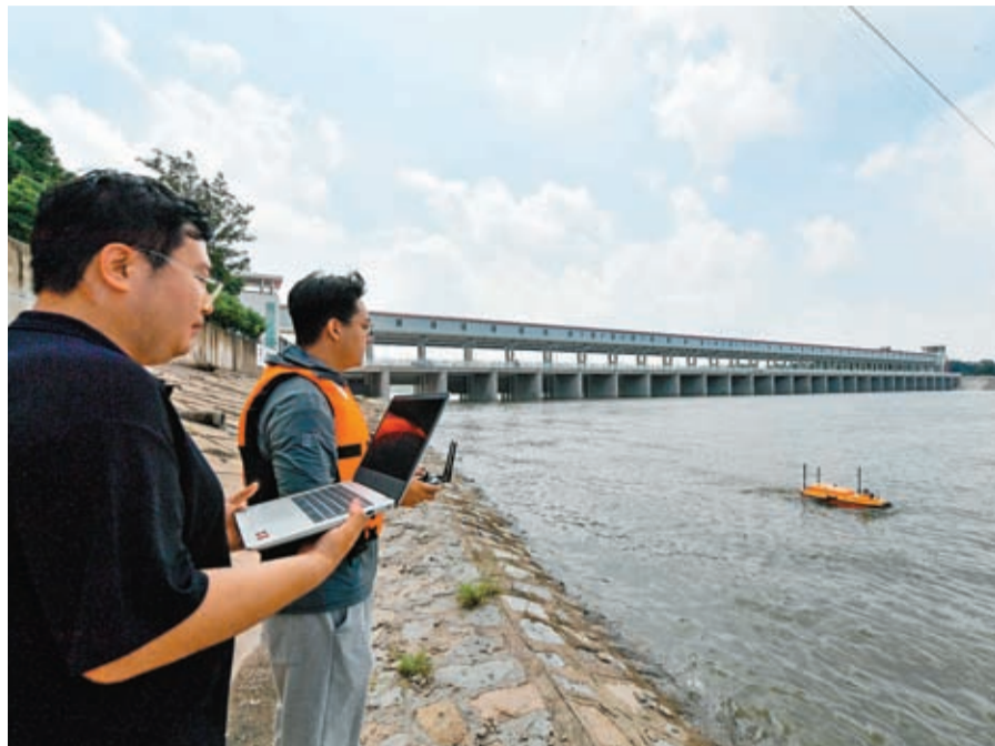
◆一萬億元人民幣增發國債中，超過一半用於防洪排澇等相關水利設施建設，超過2,000億元人民幣用於京津地等地的災後重建。圖為2023年8月，在天津市獨流減河泄洪閘上游，水文人員操作無人水文監測船進行水文監測。 資料圖片

展望全年，廖岷說，相信隨着各項政策組合效應進一步放大，不但會鞏固和增強宏觀經濟回升向好態勢，也會給推動供給側結構性改革、發展新質生產力帶來積極作用，這將有利於中國經濟保持中長期增長態勢，築牢財政可持續性的堅實基礎。