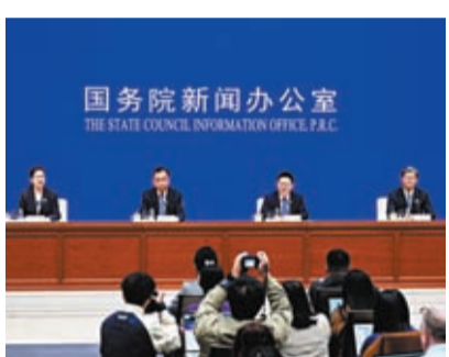
◆國務院新聞辦公室21日在北京舉行新聞發布會，介紹近期投資、財政、金融有關數據及政策情況。

年來財政部參與建設一流營商環境，關稅總水平降至全球較低水平，清理政府採購中區別對待內外資企業的規定，與多國實現會計標準、審計標準互認，加大對知識產權的財政經費保障。