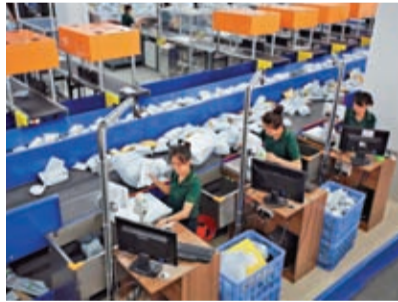
◆跨境郵件由東莞國際郵件互換局（兼）交換站出發，從港深等機場直飛全球。

調查發現，受訪企業最看好清潔能源、信息技術等行業的增長前景，分別有近一半和超過三分之一的海外企業預計這兩個行業在未來一年內將實現顯著增長。在綠色轉型方面，最具增長前景的是可再生能源、電動汽車和電動汽車電池等行業。此次調查面向全球16個主要