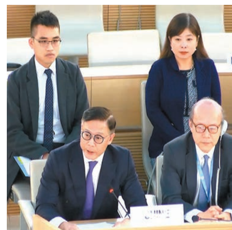
律政司副司長張國鈞（前排左）在瑞士日內瓦出席聯合國人權理事會第55屆會議，就維護國家安全條例草案立法發言。

張國鈞作為中國代表團成員出席聯合國人權理事會第55屆會議並同有關方面進行交流，促進國際社會對維護國家安全條例立法工作的理解和支持。