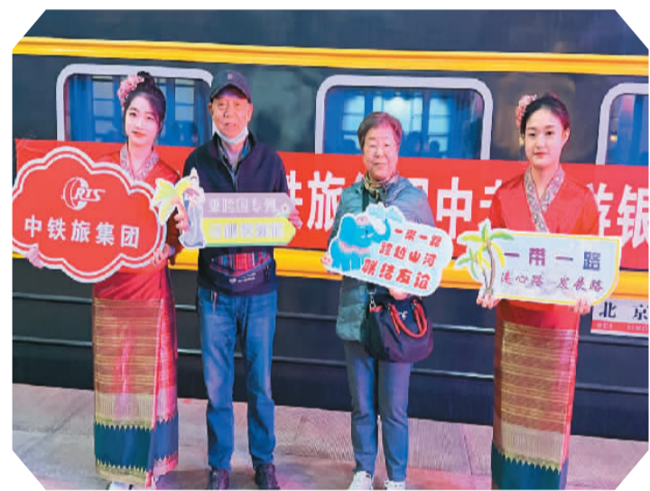
乘坐北京至老挝跨境旅游列车的游客在北京站拍照留念。

本报电（张雅、李睿）近日，Y445次旅游专列满载400余名游客从北京站出发，驶向老挝。这是中国铁路旅行社集团推出的2024年北京至老挝首发跨境旅游列车。 据悉，本次跨境游采用“国内旅游专列+国际跨境列车”的模式，行程共15天，游客可深入体验中老两国的自然风光和人文风情。在国内行程中，游客乘坐旅游专列前往张家界、昆明、成都等热门旅游目的地；在国际行程中，游客乘坐中老铁路国际跨境列车前往万象凯旋门、古都琅勃拉邦大皇宫、普