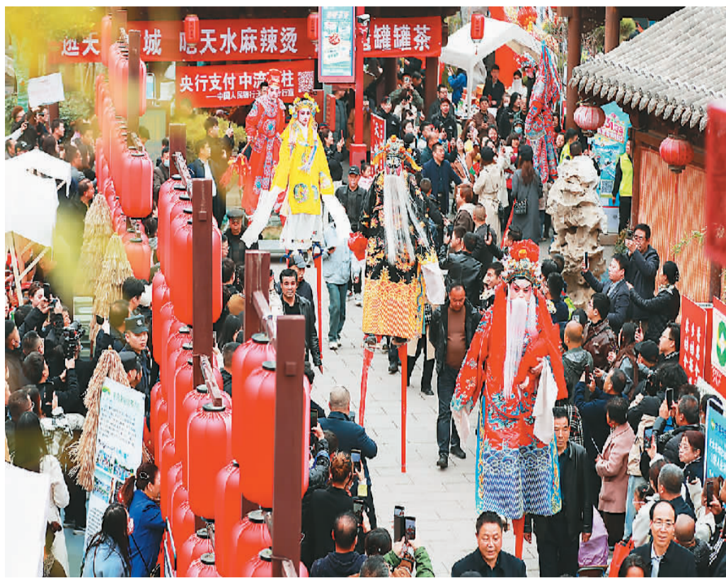
甘肃天水“吃货节”现场表演传统民俗高跷。

近日，甘肃省天水市麻辣烫频频登上社交平台热搜。一碗麻辣烫让西北小城火出圈。食客变游客，美食带旺旅游，“因吃而动，寻味而游”的美食旅游成消费新趋势，给当地发展带来新机遇。