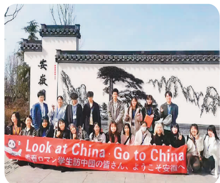
日本游客在安徽合肥园博园参观游览。

本报电（王惜）近日，春秋旅游接待了由大学生组成的日本赴华游学团。日本游客游览了雄伟秀丽的黄山，纷纷表示被壮观的山川景色所震撼；参观了安徽名人馆、青阳腔博物馆等景点，加深了对中国历史文化的理解；在合肥品尝了，他们品尝了臭鳃鱼、酥饼、臭豆腐、毛豆腐等安徽风味美食，感受中国美食文化的博大精深。此外，他们还到访了中国科学技术大学和安徽大学，并进行学术交流，优美的校园环境 and 浓厚的学术氛围给他们留下了深刻印象。