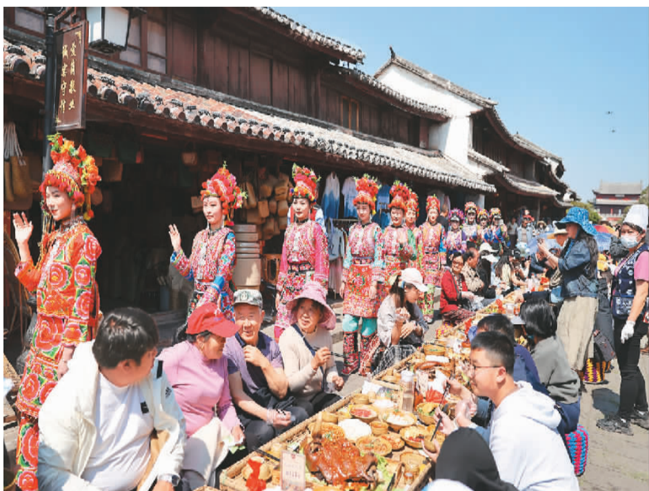
第十一届中国大理巍山小吃节近日举办，身着民族服装的演员在巍山古城牛头街街上欢迎游客。