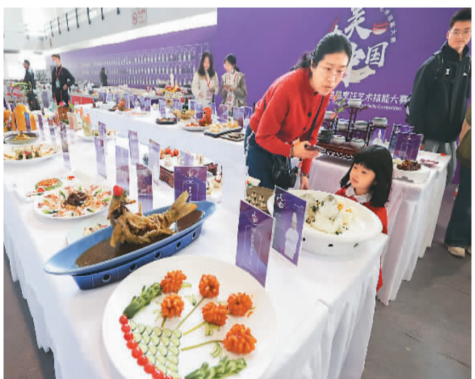
大美中国·首届烹饪艺术技能大赛近日在北京举办，观众在大赛现场观看参赛菜品。