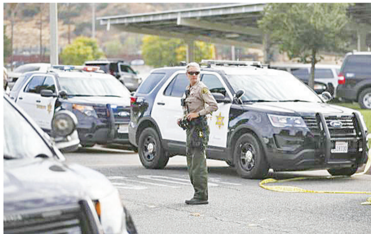
2019年11月14日,在美国加利福尼亚州洛杉矶县圣克拉丽塔市,警察在发生枪击的学校警戒。

新华社北京3月22日电 美国加利福尼亚州洛杉矶县警方缺少交通工具,看守所关押的嫌疑人中多达三分之一无法及时出庭受审,看守所人满为