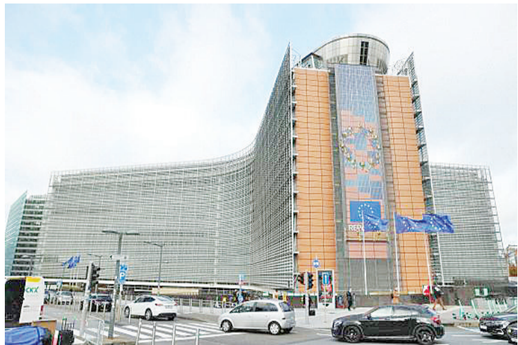
这是2023年11月15日在比利时布鲁塞尔拍摄的欧盟委员会总部大厦。

新华社北京3月22日电 欧洲联盟委员会主席乌尔苏拉·冯德莱恩21日说,欧盟拟对俄罗斯和白俄罗斯的谷物、油菜籽及其衍