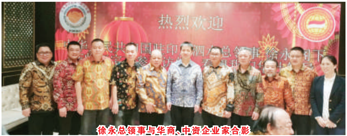
徐永总领事与华商、中资企业家合影