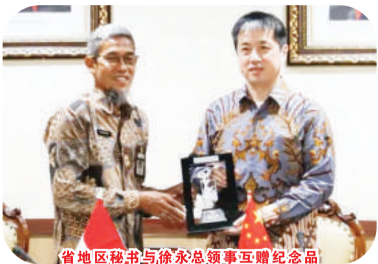
省地区秘书与徐永总领事互赠纪念品

徐永总领事会见中爪哇省地区秘书苏玛诺、三宝垄市长伊达，慰问当地侨领与华商，走访三宝垄国立大学、中爪哇清真寺，考察中印尼“两国双园”项目巴塘工业园区等地。王领事与孙领事陪同访问。