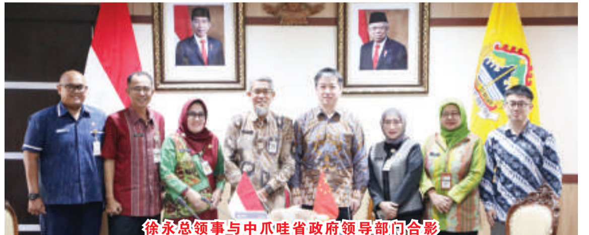
徐永总领事与中爪哇省政府领导部门合影