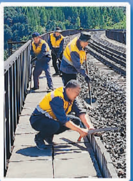
中国铁路沈阳局集团有限公司通化工务段通化桥隧车间通化桥隧第一维修小组