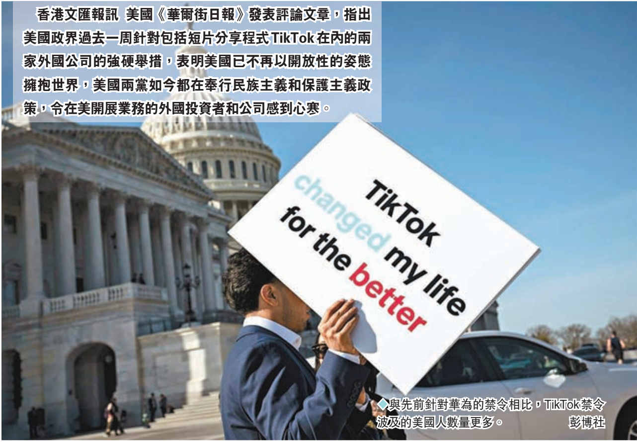
香港文匯報訊 美國《華爾街日報》發表評論文章，指出美國政界過去一周針對包括短片分享程式TikTok在內的兩家外國公司的強硬舉措，表明美國已不再以開放性的姿態擁抱世界，美國兩黨如今都在奉行民族主義和保護主義政策，令在美開展業務的外國投資者和公司感到心寒。