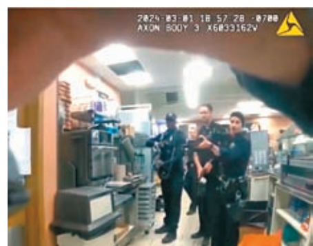
◆警員5秒鐘內向疑犯開36槍。

丹佛警方表示，3月1日，4名警員接報後，使用工具突入便利店後方一個房間，發現疑犯使用尖銳工具威脅便利店員工。影片畫面顯示，疑犯在拒絕放下武器後，警察隨即近距離開槍，在5秒內向其射出36發子彈。疑犯之後在醫院傷重死亡，事件中的4名警員正等候調查。