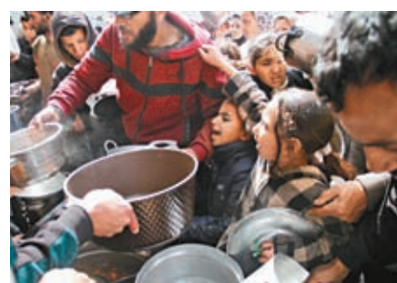
◆加沙半數民眾正處於「災難性」飢餓狀態。

聯合國糧食組織(FAO)副秘書長貝克多表示，總人口中有50%處於災難性、幾乎是饑荒的程度，以前從未發生過，這也是2004年啟動的「糧食安全階段綜合分類」系統，記錄到最多的人面對災難性飢餓的一次。聯合國人道事務與緊急援助負責人格里菲斯呼籲以色列允許援助物資不受阻礙地送入加沙，指出「已沒有時間可浪費」，「國際社會應要為未能阻止這種狀況而覺得羞愧。」