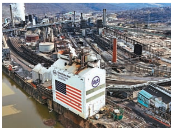
◆拜登反對新日本製鐵公司收購美國鋼鐵公司。

去年中國一躍成為全球最大汽車出口國，美國官員擔心這可能會破壞美國培育本土電動車產業的計劃。特朗普將對中國汽車徵收的關稅稅率提高到27.5%，拜登政府官員正討論進一步提高對中國電動車的關稅，他們擔心27.5%的稅率無法將中國電動車拒之門外。一些美國官員私下依然承認，美國公司會受惠於與日本製鐵和寧德時代等外國公司的合作。只是別指望拜登或特朗普會在今年競選活動中提出這樣的觀點。