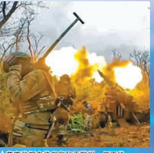
▲ 普京強調支持與烏和平談判，但不能只是因為對方子彈快用完。資料圖片

普京說，「無論他們想恐嚇誰，無論他們想壓制我們，我們的意志、我們的意識，歷史上從來沒有人在這樣的事情上取得過成功。它現在不起作用，將來也不會起作用。絕不。」針對白宮有關俄總統選舉「不自由」、「不公平」的批評，普京進行了反駁，表示美國政府在批評其他國家民主進程的同時，還動用國