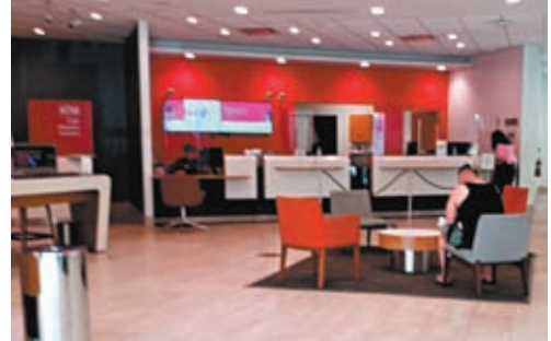
◆ 銀行提供的理財建議，被指不符合客戶利益。

香港文匯報訊 (特約記者 成小智 多倫多報導) 加拿大5大銀行傳壓迫員工向客戶推銷高成本或高風險金融產品，若員工未能達標將會遭到解僱。