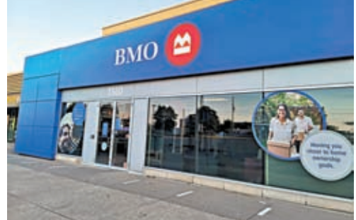
◆ 滿地可銀行前員工承認無法承受推銷壓力而選擇辭職。