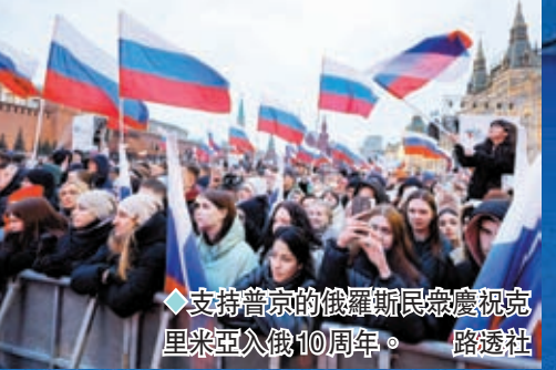
◆ 支持普京的俄羅斯民眾慶祝克里米亞入俄10周年。