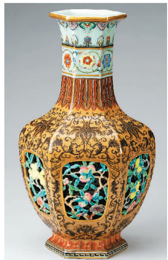
清乾隆款景德镇窑外粉彩内青花镂空花果纹六方套瓶。

在展览第五部分“京师繁会 帆樯络绎”，国家一级文物清乾隆款景德镇窑外粉彩内青花镂空花果纹六方套瓶光彩夺目。此瓶主体为酱褐色釉，口足部施金釉，用金银双色及红黄彩等勾绘缠枝花卉、蕉叶等纹饰，镂空开窗处饰有粉彩西番莲、佛手、寿桃纹等，内瓶上精绘青花缠枝花卉，底部有青花篆书“大清乾隆年制”落款。