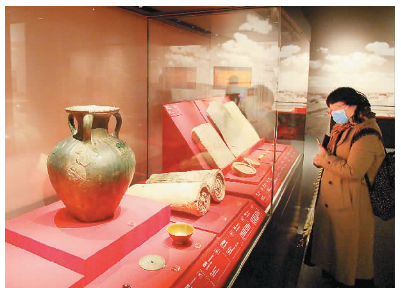
日前，在首都博物馆开展的“载瞻载止——新疆考古百年”文物展吸引了许多观众参观。展览以新疆考古百年来的发展为主线，分为“蓝缕革路启朝华”“规模渐具开闢闢”“前行砥砺致致远”三部分。