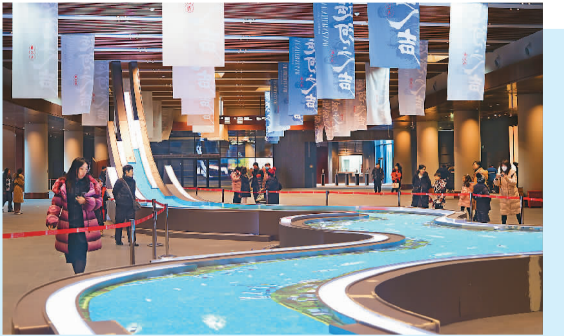
观众在北京大运河博物馆参观。