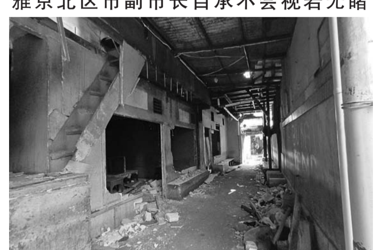
雅京北区市罗雅街(Gang Royal)一角

【本报讯】3月18日，雅京北区市副市长朱艾尼(Juaini Yusuf)声称，本府并没有切断罗雅街(Gang Royal)居民的生计来源。