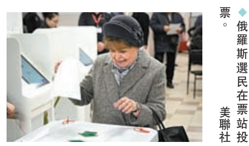
◆俄羅斯選民在票站投票。

斯科當地時間21時，投票率已達58.1%。俄中央選舉委員會將不晚於28日確認選舉最終結果，並在確認後3日內公布。