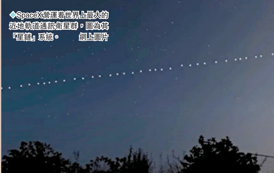
◆SpaceX營運着世界上最大的近地軌道通訊衛星群，圖為其「星鏈」系統。

「星盾」網絡是美國與其對手之間競爭的重要一環，目的是成為太空領域的主導軍事力量，特別是通過擴大間諜衛星系統，使其不再使用高軌道上笨重而昂貴的航天器，反而低軌道上的龐大網絡可以提供更快的地球影像。路透社稱，五角大樓曾對俄羅斯的「太空武器威脅」發出警告，指出這些「威脅」可能會使整個衛星網絡癱瘓，「星盾」的目標是提高美國抵禦來自精密太空力量攻擊的能力。