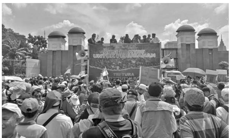
拒绝选举结果示威群众

3 月 18 日，伊戈尔声称，例如政府的态度是不采取镇压行动，仍然必须给予保护。群众走上街头，拒绝接受 2024 年大选的全国总结结果。然而为了避免出现 2019 年大选那样发生群众与警察之间的冲突，示威者的表现也不允许是无政府主义行为。这一切的发生会在示威中引发冲突，导致群众与警察之间的冲突。对大选对总结结果做出反应的群众必须以有序的方式进行，而不是无政府主义状