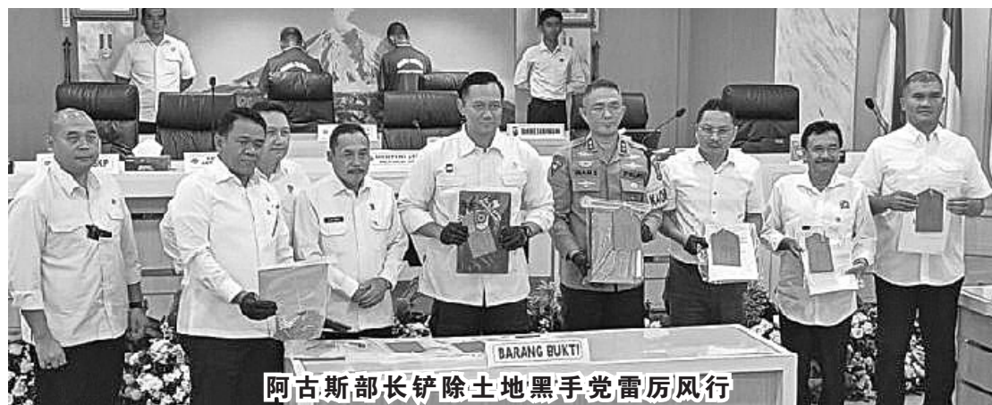
阿古斯部长铲除土地黑手党雷厉风行

阿古斯部长表示，我们不仅与外部各方合作，还致力于在土地与空间规划部长/国家土地局内部维护正义。如果有人犯下非法行为，无论是外部还是内部人员，都必须得到同样的处理方法，我们将采取果断行动。因此如果涉及内部队伍，我们将坚定地采取行动。但是也不希望我们内部成为受害者，因为我