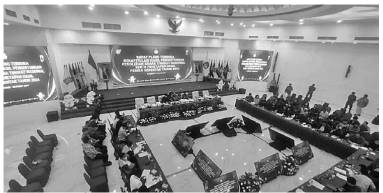
普选委已通过了 33 个省区统计票数

3 月 17 日晚上，普选委主席哈欣(Hasyim Asy'ari)表示，还有五个省份需要在国家层面进行概括。我们目前的议程只针对中巴布亚省、巴布亚省、高地巴布亚山省(Papua Pegunungan)、西北巴布亚省、马鲁古省与西爪哇省。另外，在吉隆坡重新选举的结果需要在国家层面的全体会议上讨论。还有一次对吉隆坡重新选举结果的总结，我们将对所有国外普选委的选票，即 128 个国外普选委进行总结，然后我们总结起来。另外，再加上雅加达第二选区的一部分选票，即雅加达中