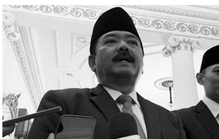
政治、法律和安全统筹部长哈迪(Hadi Tjahjanto)。

【本报讯】政治、法律和安全统筹部长哈迪(Hadi Tjahjanto)保证，直到2024年圣斋月与开斋节国内治安将平安无事。我已就安全问题与军警进行了协调。对于开斋节活动，没有干扰，一切都很安全。政府还与宗教和社会规划部建立了沟通，以实现这一目标。