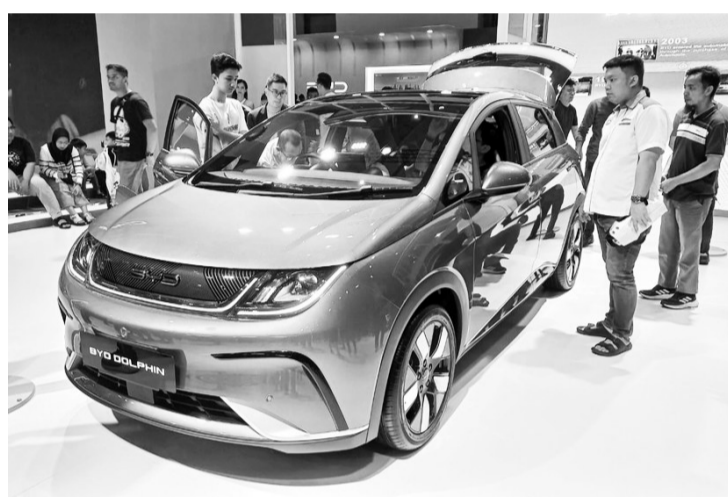
比亚迪积极推动我国电动汽车加速发展。

【本报讯】实现我国向电动汽车时代过渡的加速，印尼比亚迪汽车公司以及国电集团的协同效应，比亚迪乐观地覆盖了各行各业更广泛的消费者。随着国电公司的转型，PLN Icon Plus公司承担了新的角色，作为PLN的子控股公司，处理电力以外的业务线(Beyond kWh)。