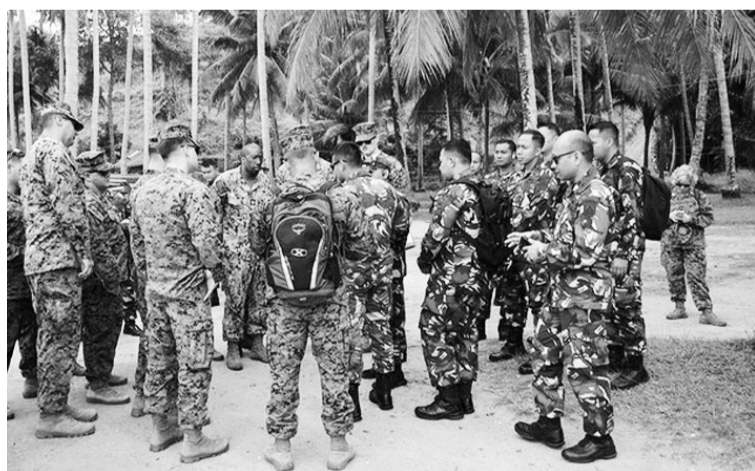
印尼海军和美军代表讨论联合军演活动。

【本报讯】我国海军与美国海军、美国海军陆战队一起在楠榜省Ratai湾周围将用作训练区的地点进行审查，例如港口、海滩、海域、陆地和其他将在演习期间使用的设施。同时，最终规划会议于3月14日至15日在楠榜喜来登酒店举行，为期两天。