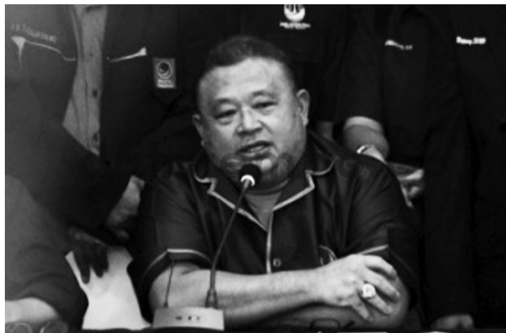
民族民主党秘书长达斯林(Hermawi Taslim)。

他认为，若是提交国会调查权，民族民主党、民族复兴党和公正福利党在国家议会中的权力就足够了。三个政党已足够条