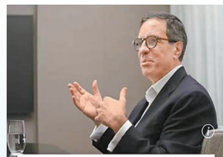
Banking & Finance

摩根大通，又稱「小摩」，總部位於美國紐約市，業務遍及50多個國家，全球擁有約32萬名員工，資產規模計算為美國最大的金融服務機構。今年1月該行公布去年業績，年利潤超過美國銀行業歷史任何一家銀行。去年全年該行錄得盈利496億美元，較2022年增長32%，較2021年突破的創紀錄值的483億美元也要高。美國六大銀行直到2018年才達到1000億美元的年利潤，而摩根大通在2023年幾乎達到了這一數字的一半。