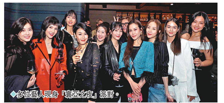
◆多位藝人現身「寰亞之夜」派對。