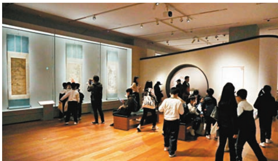
◆市民參觀「香港賽馬會呈獻系列：故事新說——故宮博物院藏 明代人物畫名品」第二期展覽展品。