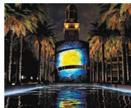
◆「梵高·樂印」展覽構想圖。

◀「teamLab: 光漣」展覽，在添馬公園和中西區海濱長廊之間的路段以及海面，會有數百個3米至5米夜光彩蛋（ovoid）的藝術裝置。