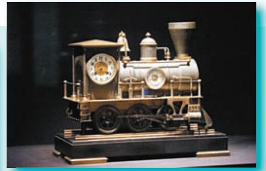
▲首度亮相的火車頭式鐘。