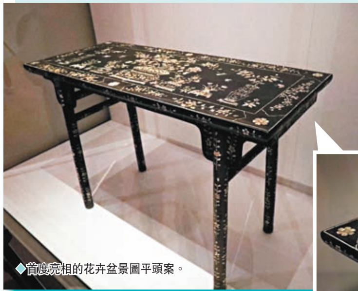
◆首度亮相的花卉盆景圖平頭案。

另外，「香港賽馬會呈獻系列：故事新說——故宮博物院藏 明代人物畫名品」第二期共20套全新珍品，於13日起在香港故宮文化博物館展廳4開放予公眾參觀。本期重點展品包括唐寅和仇英的佳作，二人均為「明四家」中的翹楚。當中一幅國家一級文物唐寅的《風木圖》繪風中枯木兩株，一文士倚坐樹間，掩面哭泣，似在悲思故人。「風木」比喻父母亡故，未及奉養。