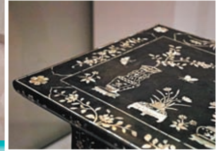
◀花卉盆景圖平頭案由兩地文保人員攜手修復。