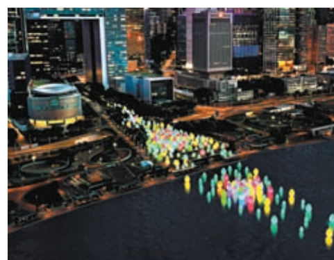
◆由國際藝術團隊 teamLab 打造的「teamLab: 光漣」展覽構想圖。