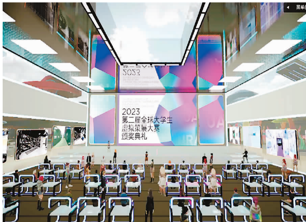
▲第二届全球大学生虚拟策展大赛云端颁奖典礼