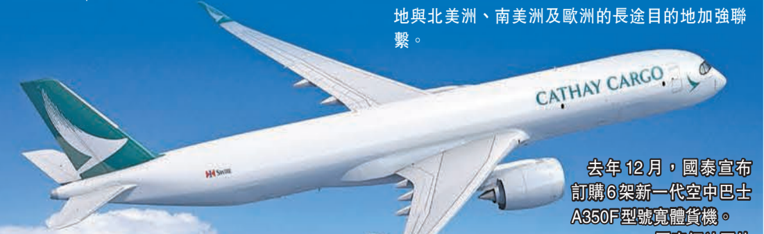
去年12月，國泰宣布訂購6架新一代空中巴士A350F型號寬體貨機。

國泰表示，A350F貨機是全球技術最先進的貨機，此貨機的機身採用的是堅固而輕量的複合材料和鈦金屬，不僅可提供更高的燃油效益，操作亦更簡便。購入此款貨機，有助進一步鞏固香港的全球第一航空貨運樞紐地位，亦有助香港與內地與北美洲、南美洲及歐洲的長途目的地加強聯繫。