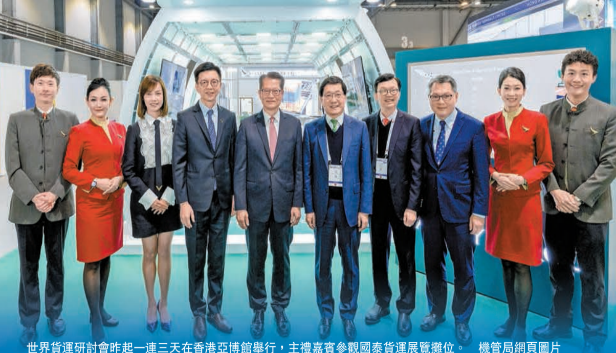
世界貨運研討會昨起一連三天在香港亞博館舉行，主禮嘉賓參觀國泰貨運展覽攤位。