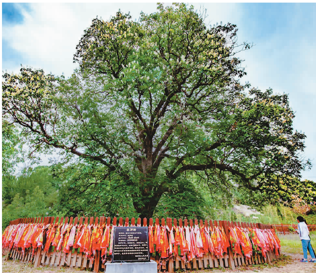
陕西省铜川市宜君县大安镇艾蒿洼村,相传为玄奘从天竺带回的娑罗子长成的大树。