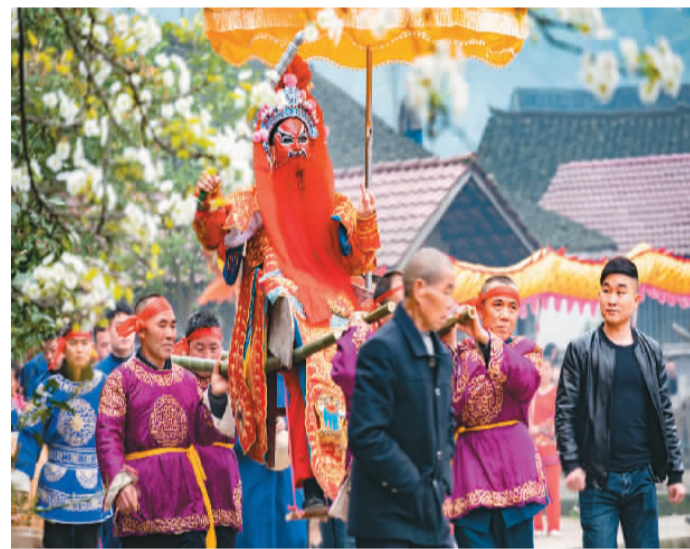
国家级非遗项目“辰河目连戏”走进田间地头。