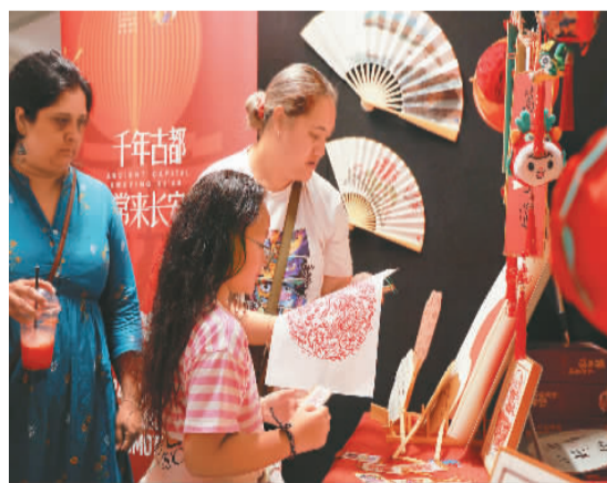
新西兰奥克兰市民体验印制中国木版年画。

日前,地处澳大利亚悉尼情人港的澳大利亚国家海事博物馆平台大厅和码头露天剧场张灯结彩,喜庆热闹,西安市文化和旅游局“盛唐国潮畅游会”在此举行。畅游会采用室外舞台表演加室内国潮畅游体验的形式,当地民众手持印有祥龙纹样的打卡卡片,尽情参与中国传统乐器、戏曲、舞蹈、书法、绘画、香道等文化体验活动。