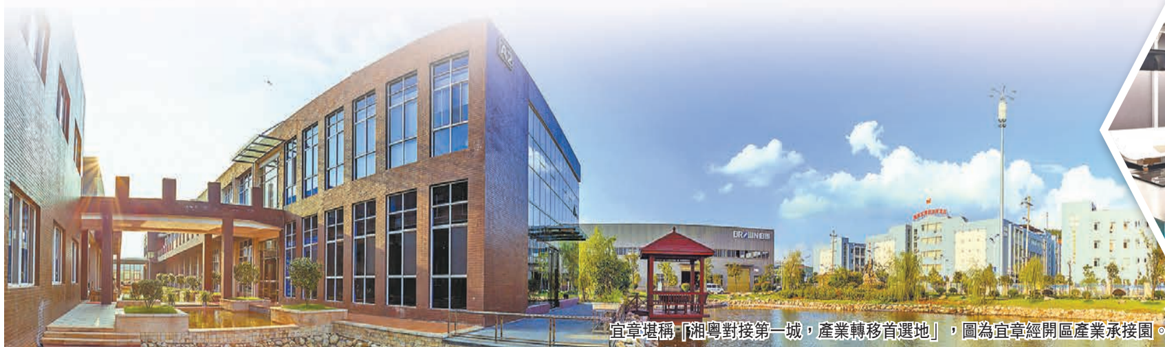
宜章堪稱「湘粵對接第一城，產業轉移首選地」，圖為宜章經開區產業承接園。