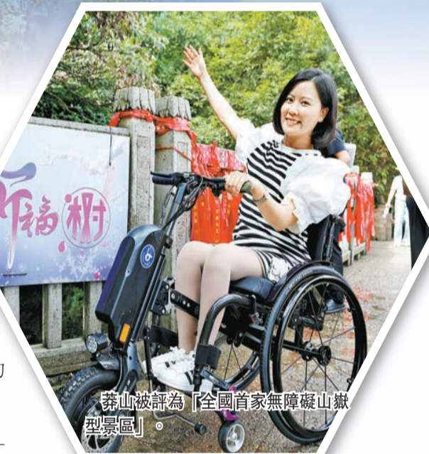
莽山被評為「全國首家無障礙山嶽型景區」。

當年李白暢想，「腳着謝公屐，身登青雲梯」。如今「青雲梯」登台莽山，再造新興旅遊範式——由爬山涉水「苦遊」，到走山看水「樂遊」，再到遊山玩水「暢遊」。為留住大灣區遊客，莽山與廣州大灣區旅行社精心設計路線，啟動「攜手大灣區、萬人遊莽山」活動。2024年新年伊始，廣