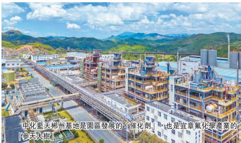
中化藍天郴州基地是園區發展的「催化劑」，也是宜章氟化學產業的「參天大樹」。