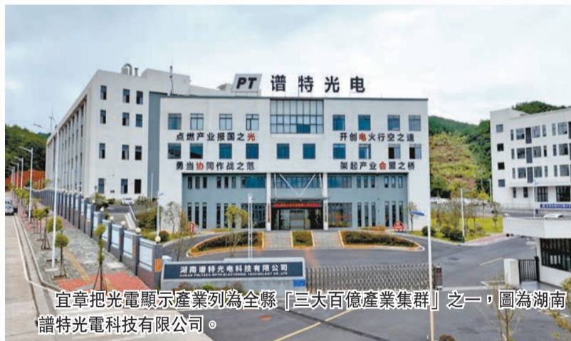
宜章把光電顯示產業列為全縣「三大百億產業集群」之一，圖為湖南譜特光電科技有限公司。

隨着光伏、風能、鋰電池等新興行業的崛起，高端氟領域獲得了廣泛關注。亞洲最大、世界第二，宜章特有的單體整裝露天螢石礦，為氟化學產業發展提供了充足資源保障。