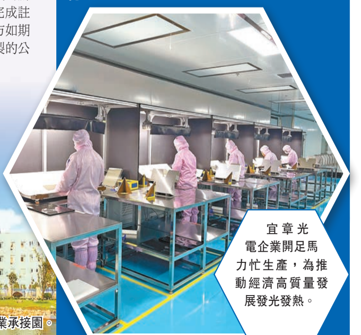
宜章光電企業開足馬力忙生產，為推動經濟高質量發展發光發熱。

如果把城市比作一個人，那麼產業就是他的骨骼。有了骨骼，身軀才能挺立；有了產業，城市才能崛起。從文旅產業、氟鋰產業再到光電產業，宜章挺起了產業發展的脊梁，高質量發展之路越走越寬闊。