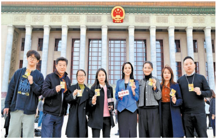
本報記者在人民大會堂前合影。

前後方密切聯動，扛下一場場新聞硬仗的考驗，香港商報「新聞鐵軍」終於圓滿完成此次全國兩會的新聞報道工作。