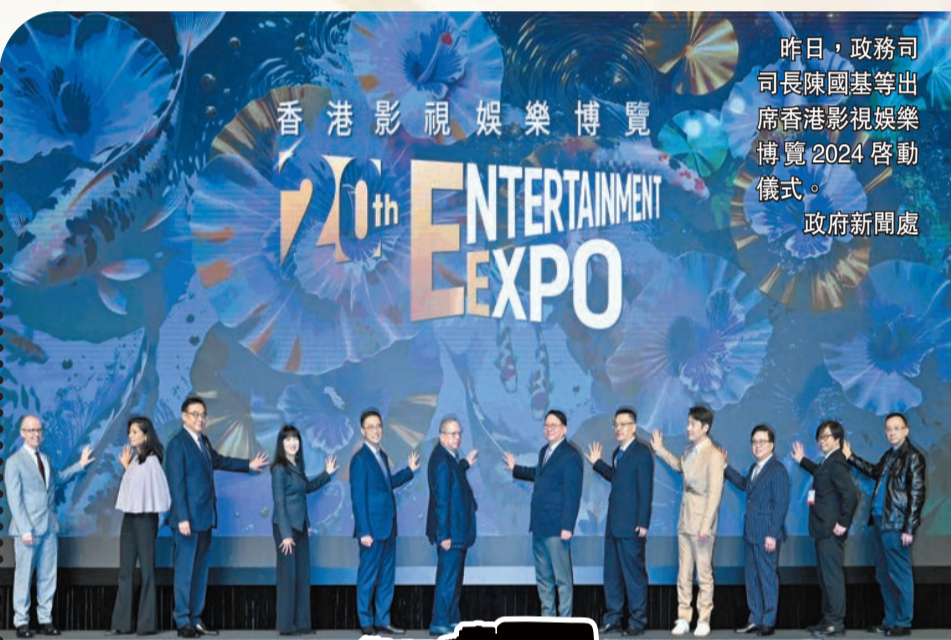
昨日，政務司司長陳國基等出席香港影視娛樂博覽2024啓動儀式。

【香港商報訊】記者余樂祖、姚一鶴報道：作為特區政府「藝術三月2024」的頭炮活動之一、由香港貿發局主辦的香港影視娛樂博覽昨起一連四天在灣仔會展中心舉行，涵蓋10項影視娛樂活動（詳見列表）。昨日，香港國際影視展及亞洲影視娛樂論壇啓動，活動雲集業界領袖及環球展商，展示最新影視作品和科技，分享環球業界議題，促進業界拓展國際市場新機遇，進一步促進香港發展成為中外文化藝術交流中心，鞏固香港作為區域知識產權貿易中心的角色。其間，阿里大文娛集團更拋出「震撼彈」，未來5年至少投入50億元，聯合其他本港文化娛樂公司共同推進「港藝振興計劃」，阿里影業也將在港打造第二總部。