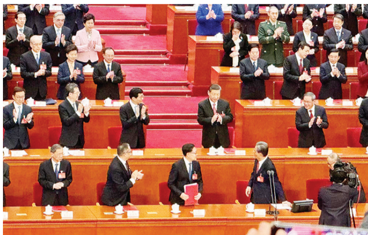
中共中央总书记、国家主席习近平、国务院总理李强等领导人出席闭幕会议。