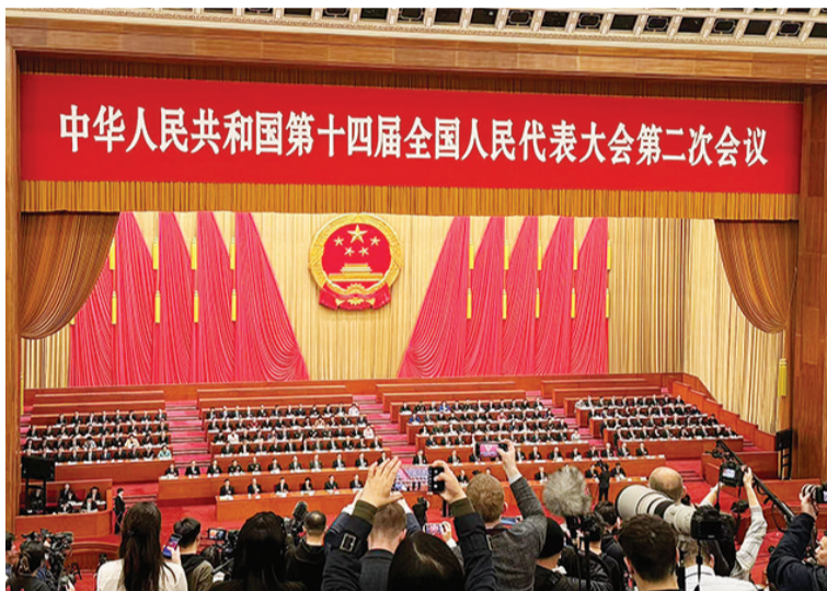
数百名境内外记者拍摄全过程。

中国式现代化蓝图已绘,中国向“新”而行、撬动新发展,科技创新依然是制胜未来的“关键变量”。