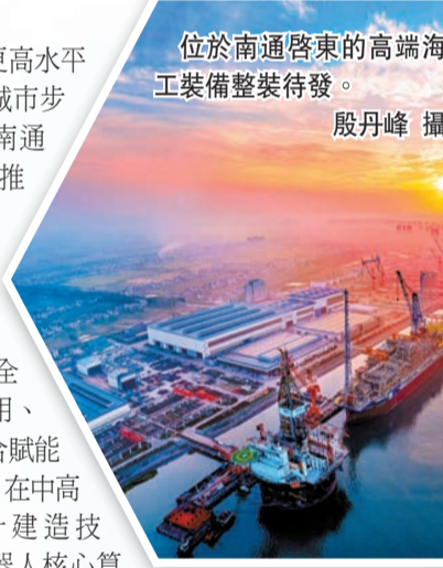
位於南通啓東的高端海工裝備整裝待發。