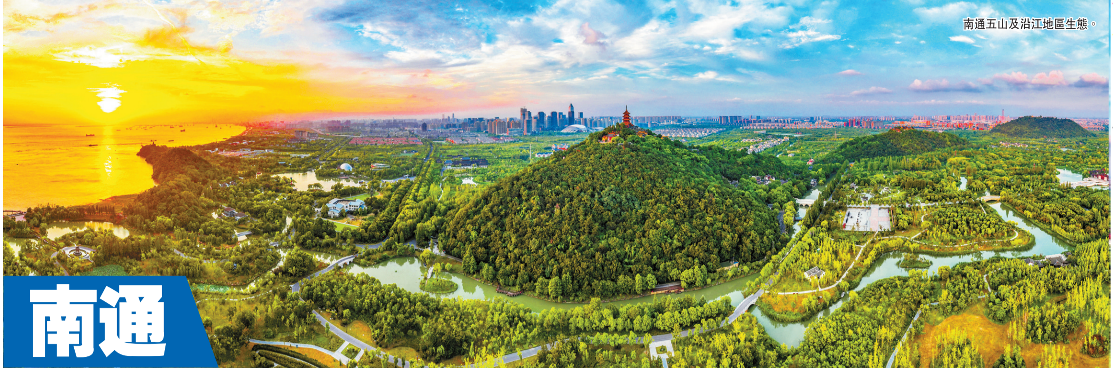
南通五山及沿江地區生態。