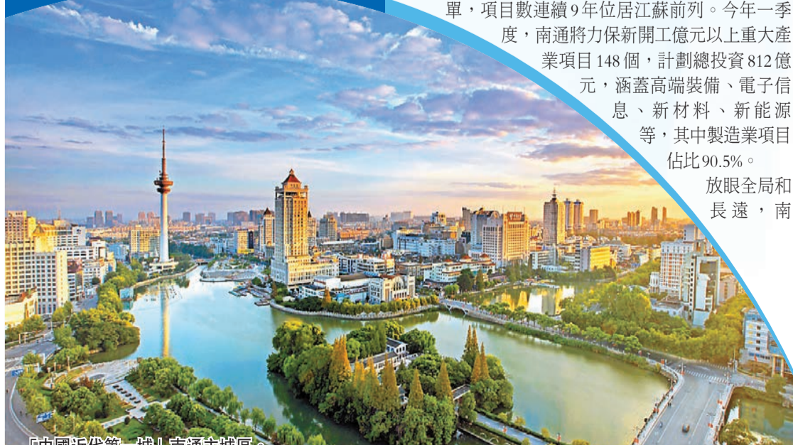
「中國近代第一城」南通全城區。

走過滄桑巨變，萬億之城再出發。迎來新一輪跨越式發展的黃金機遇期，南通有底氣、有信心、有幹勁，奮力打造中國現代工業名城，以新型工業化的生動實踐再現中國近代民族工業發祥地的歷史榮光，為打造江蘇高質量發展重要增長極提供有力支撐。