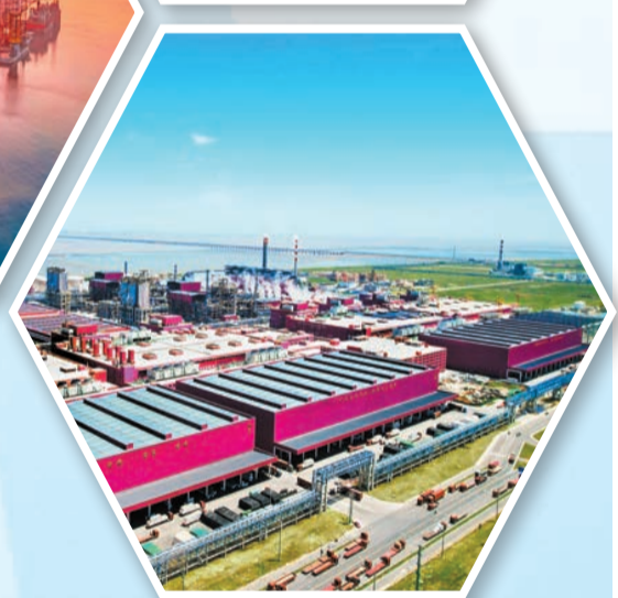
南通如東嘉通能源——桐昆聚脂一體化項目