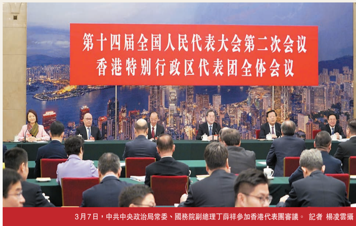
3月7日，中共中央政治局常委、國務院副總理丁薛祥參加香港代表團審議。

【香港商報訊】記者黃雪峰、林駿強報導：3月7日，中共中央政治局常委、國務院副總理丁薛祥參加香港代表團審議。丁薛祥指出，香港基本法第23條立法要盡早完成，堅定維護國家主權、安全、發展利益，確保香港長治久安。 (尚有兩會報道刊A3、A4版)