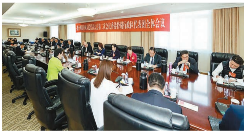
昨天下午，香港代表團舉行全體會議。中聯辦網站圖片

【香港商報訊】據中聯辦網站消息，3月7日下午，十四屆全國人大二次會議香港代表團舉行全體會議，審議國務院組織法修訂草案。全國人大代表、中聯辦主任鄭雁雄參加審議時表示，丁薛祥副總理上午安排專門時間到香港代表團聽取審議意見和工作建議，帶來了習近平主席和中央對香港的關愛和囑託，表達了中央對香港由治及興的全力支持、堅定支持，讓我們倍感親切、倍感溫暖、倍感振奮。丁薛祥副總理的指示要求非常切合香港實際，我們要深入領會思考、貫徹落實。