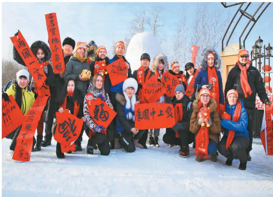
俄罗斯游客在黑河市爱辉区体验“爱上中国年”活动。