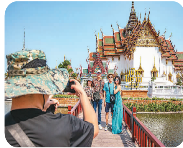
中国游客在泰国北榄府暹罗古城游览。

当地时间3月1日0时,泰国一个由20多人组成的旅行团从曼谷素万那普机场出发,前往上海。这是中泰互免签证协定正式生效后,泰国首批赴中国的旅行团。