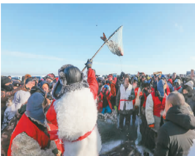
五大连池冬捕活动现场。

这个5A级旅游景区是第四纪火山活动留下的珍贵遗产,其状貌是典型的新老期火山地貌地质,被誉为“打开的火山教科书”。