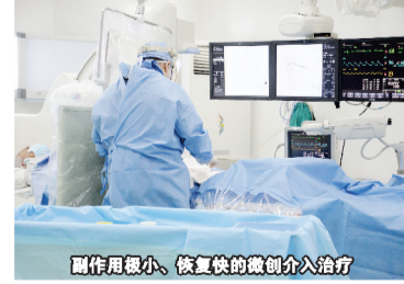
副作用很小,恢复快的微创介入治疗

2023年8月,我办理了签证和往返机票和家人顺利地飞往中国广州。一到达广州,圣丹福广州现代肿瘤医院的工作人员便亲自前来机场接我们,他们周到的服务和亲切的态度令我们感到舒适和安心。来到医院后,我进行了PET CT检查,当时结果显示肿瘤大小约为3.8cmx4.4cmx2.2cm,考虑到脐尿管恶性肿瘤伴有多发肺转移,MDT团队立即为我制定了综合微创治疗计划,包括介入治疗、粒子植入、靶向治疗和自然疗法。医生和翻译员耐心为我讲解病情和治疗方案,使我和家人感到信任和充满希望。