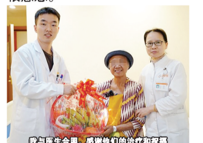
我与医生合照,感谢他们的治疗和祝福

在微创治疗过程中,我感觉我不是癌症患者,医疗旅行成为我最难以忘怀的回忆之一。在广州城内与其他患者及家属漫步,一起享受着风景和美食,我们忘却了癌症的存在。微创治疗不但让我摆脱了传统治疗的痛苦,不做卧病在床的病人,还可以维持良好的生活质量,感受生命意义,我很感恩。