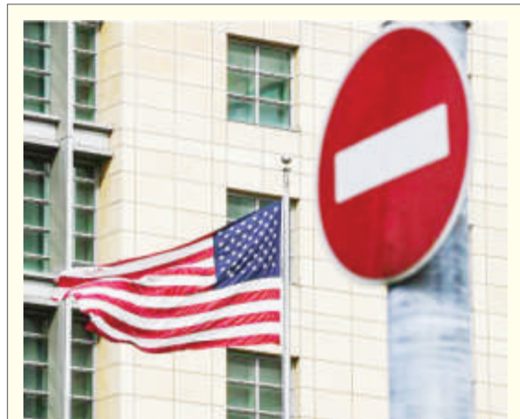
这是2021年4月16日在俄罗斯首都莫斯科拍摄的美驻俄罗斯大使馆。

字可能远高于此。苏丹一半以上人口需要救援，800多万人无家可归，其中170万人逃离苏丹，约1800万人处于严重粮食不安全状态。