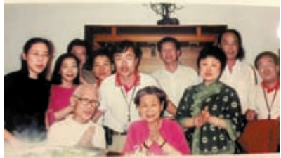
◆1998年，余光中(前坐左一)70歲大壽，余范我存(前坐右一)、柯經一(中間站立)、王慶華(後右一)等人出席。

而今余光中教授已經離世6年半，但他的詩會流傳下去，與每一代的中國人結緣，而我因受蓉子的詩感染，與葛永光、柯經一等人結緣。