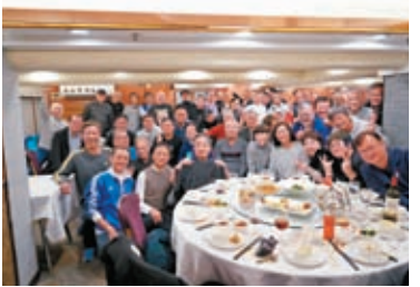
◆上世紀七八十年代體育傳媒「稿匠之友」聚首一堂。

一班資深體育傳媒人，你一言我一語，希望能讓香港體育足球回復七八十年代的光輝的日子，但時移世易時代不同環境不同，舊的方式在今天也未必盡可適用，有不同種類的體育發展與體育傳媒是相輔相成的，如游泳、單車、劍擊、乒乓球、羽毛球等等有好成績，我們體育傳媒就有更豐富的去報道。