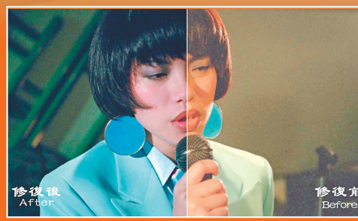
▲▼《地下情》修復前後對比。