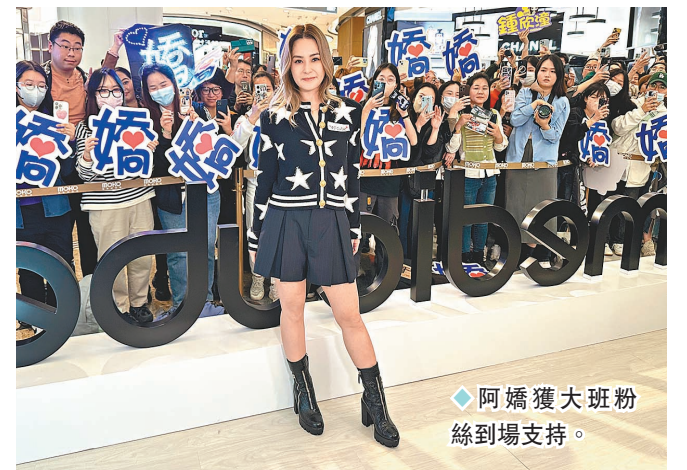
阿嬌獲大班粉絲到場支持。

香港文匯報訊（記者 子棠）鍾欣潼（阿嬌）年初為了應付14場Twins紅館演唱會元氣大傷，4日晚她出席韓國美容品牌宣傳活動時，表示經過休息、努力食和瞓後，身體雖然尚未完全復原，但狀態有好轉。