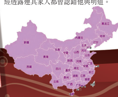
《周處除三害》在內地各省皆是日票房冠軍。