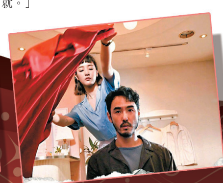
《周處除三害》令人耳目一新。