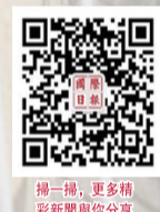
掃一掃，更多精彩新聞與你分享